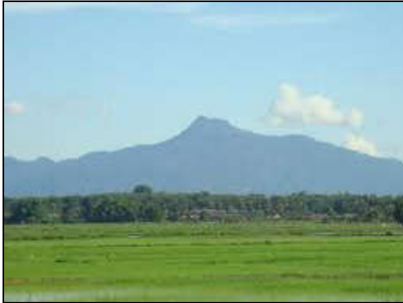
Plet 1.1: Gunung Jerai yang terletak di kawasan Lembah Bujang yang mempunyai ketinggian 1217 meter di atas aras laut telah menarik perhatian para pedagang untuk singgah berdagang di kawasan ini.

Peranan Sungai Merbok, Sungai Bujang dan Sungai Muda yang membolehkan kapal melayari sungai sehingga ke pedalaman untuk berdagang telah memesatkan pembangunan ekonomi Kedah Tua. Ini kerana Semenanjung Tanah Melayu mempunyai sungai yang lebar yang dapat menarik perhatian para pedagang untuk singgah berlabuh di kawasan ini (Tuckey, 1815:329). Perkara ini membolehkan pedagang menjalankan aktiviti perdagangan serta mendapat sumber barang dagangan dengan masyarakat di pedalaman.