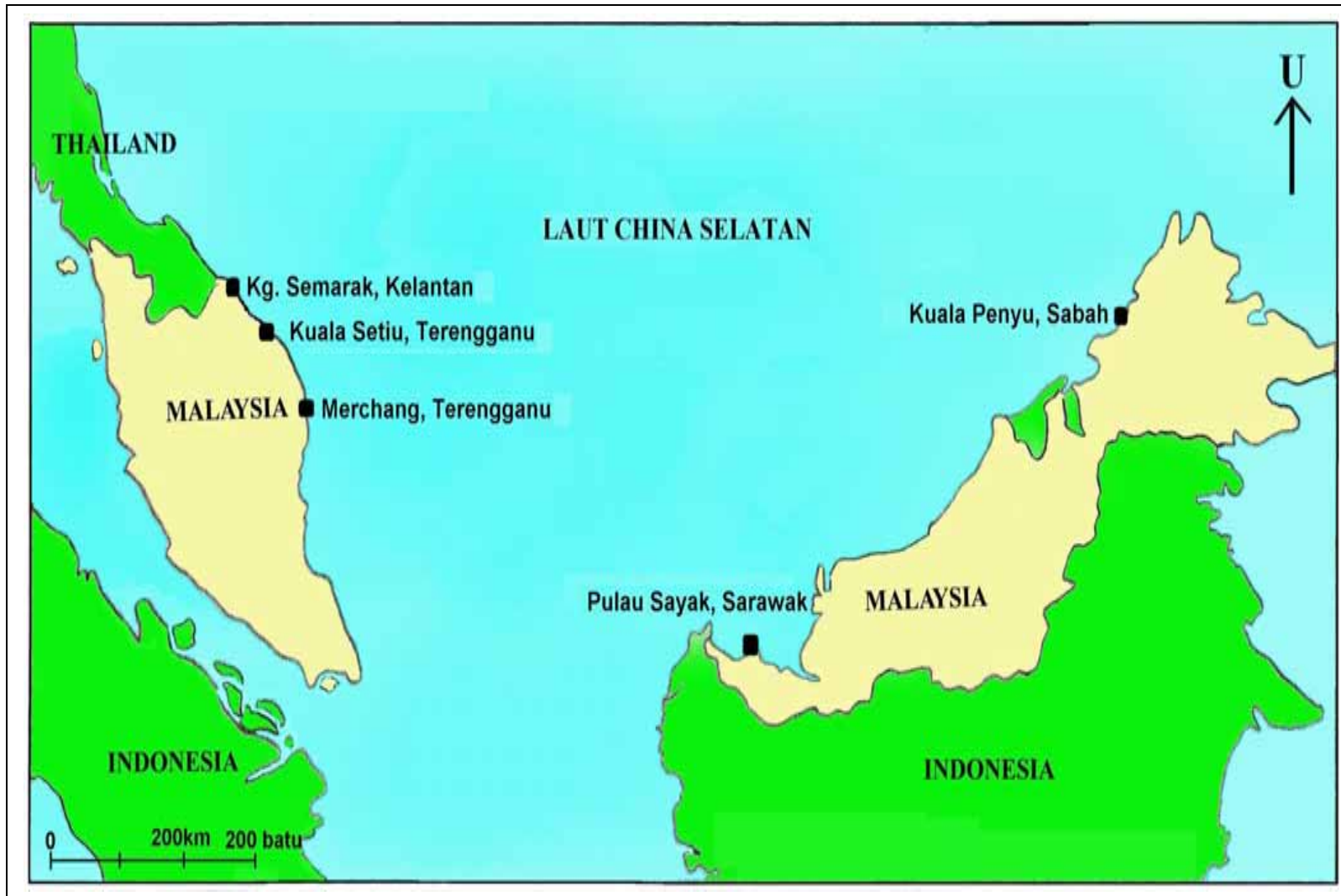
Rajah 1.1: Lokasi taburan semulajadi Crassostrea iredalei di Malaysia (ubahsuai daripada Tan, 1993).