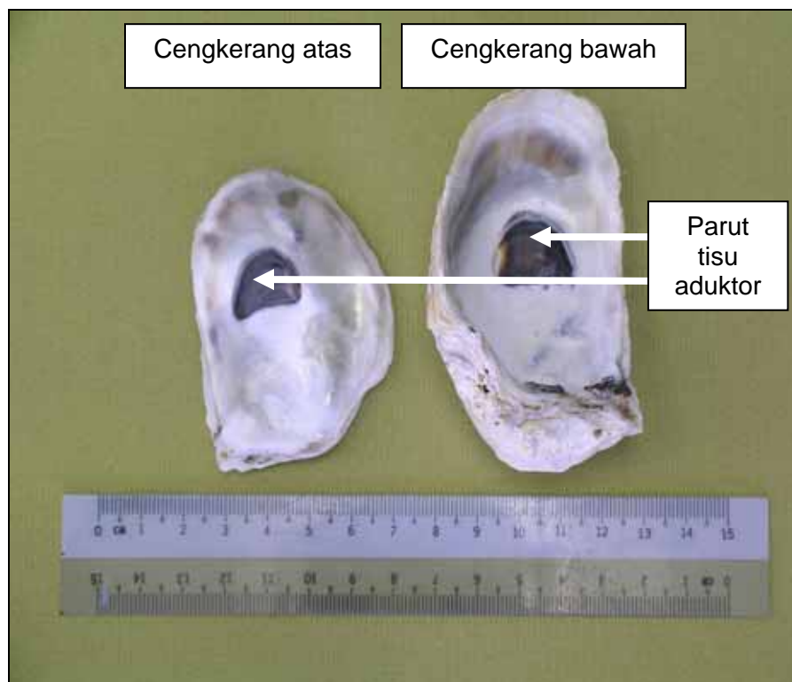
Plat 1.3: Morfologi dalam cengkerang Crassostrea iredalei .