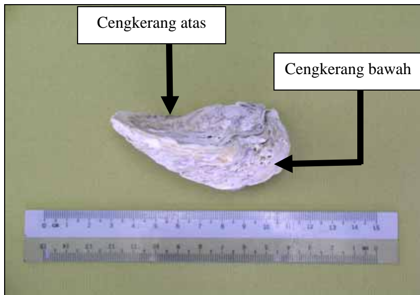
Plat 1.1: Pandangan sisi (posterior) Crassostrea iredalei .

Pemendapan C. iredalei berlaku pada permukaan dasar atau batu yang tenggelam (Rosell, 1991). Terdapat juga C. iredalei yang mendap di atas individu C. iredalei yang lain. Ini menyebabkan gumpalan individu C. iredalei boleh dijumpai. Perlekatan C. iredalei pada permukaan substrat berlaku pada cengkerang bawah ataupun cengkerang kiri.