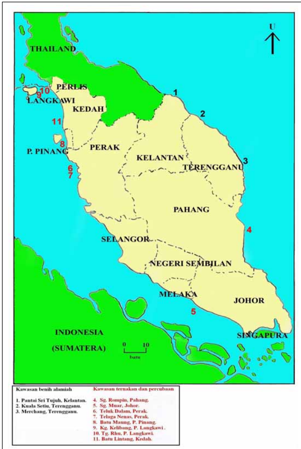
Rajah 1.2: Lokasi benih alamiah, ternakan dan percubaan Crassostrea iredalei di Semenanjung Malaysia (ubahsuai daripada Devakie, 1998).