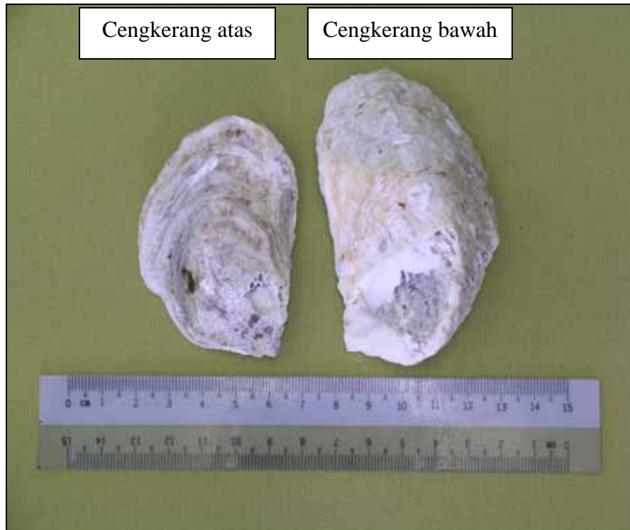
Plat 1.2: Morfologi luar cengkerang Crassostrea iredalei .