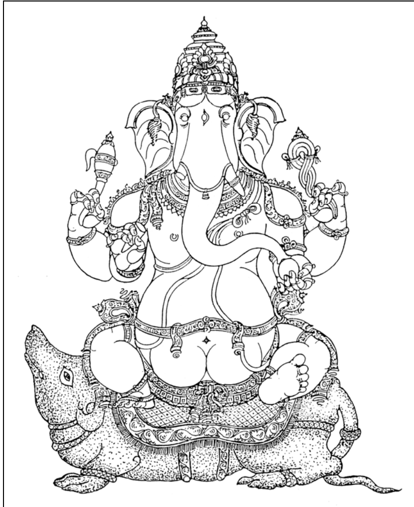
Rajah 1.1 : Lakaran Ganesa

mitos yang menerangkan tentang kelahiran Dewa Ganesa ini. Namun begitu hanya empat mitos yang begitu popular dan sering diceritakan untuk menerangkan tentang kelahiran Ganesa.