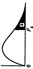
Degrees of freedom (α = .05)