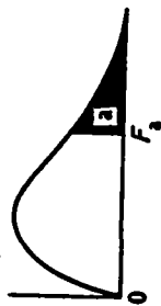
Jadual 4: Titik Peratusan Taburan F