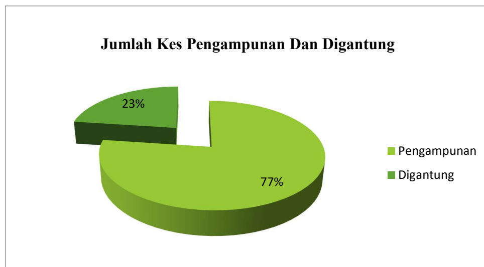
Gambar Rajah 1.2: Pecahan Kes Sabitan Hukuman Gantung