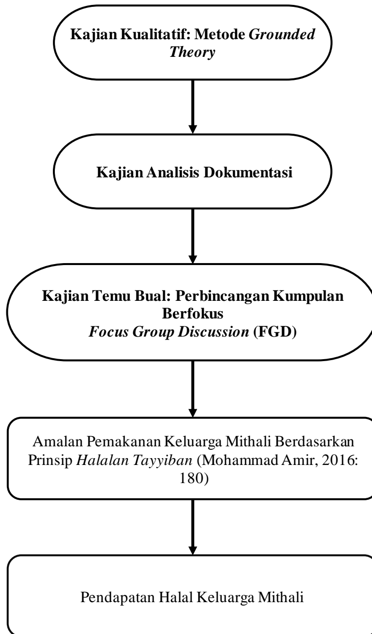
Rajah 1.2 Kerangka konseptual kajian.