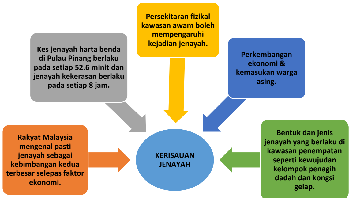
Rajah 1.1: Pernyataan Masalah Kajian Kerisauan Jenayah

mereka dengan penduduk Pulau Pinang serta menimbulkan perasaan ketidakpuasan akibat kegagalan mereka untuk diterima sebagai sebahagian daripada masyarakat bandar di Pulau Pinang. Situasi sebegini hanya akan mendorong mereka untuk melakukan jenayah bagi membebaskan diri daripada cengkaman kemiskinan dan keterasingan. Oleh itu, untuk mengatasi masalah keterlibatan jenayah di kalangan warga asing dengan efektif, kekangan ini perlulah diselidik hingga ke akar umbinya bagi memastikan situasi sebenar tahap penglibatan jenayah oleh golongan warga asing, punca-punca sebenar yang mempengaruhi golongan warga asing untuk melakukan jenayah, serta impak sosial yang wujud daripada kegiatan-kegiatan mereka. Ringkasnya, Rajah 1.1 menunjukkan beberapa permasalahan yang boleh mendatangkan kerisauan terhadap jenayah dalam kajian ini.