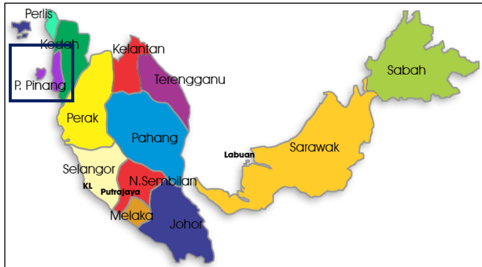
Rajah 1.2: Peta Malaysia dan Kedudukan Pulau Pinang