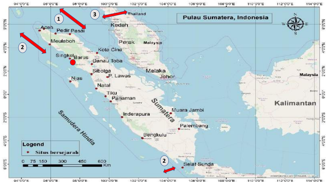
Peta 2.2 Laluan perdagangan Timur-Barat di sekitar Sumatera. Sumber: (Reid, 2010)

Maka laluan satu dan dua melibatkan terus Sumatera. Oleh kerana itulah sejak awal lagi Sumatera sudah terkenal dalam kalangan pendatang dari India, Arab atau Eropah. Oleh kerana laluan dua yang melibatkan pelabuhan di pesisir barat Sumatera yang terdedah kepada angin dan ombak besar lautan Hindi maka laluan satu yang melibatkan pesisir utara dan timur Sumatera pula menjadi pilihan utama. Reid (2010) menyatakan laluan satu menyediakan pelabuhan yang aman untuk menjadi tempat membaik pulih kapal serta berdagang kapur barus, kemenyan, emas dan lada.