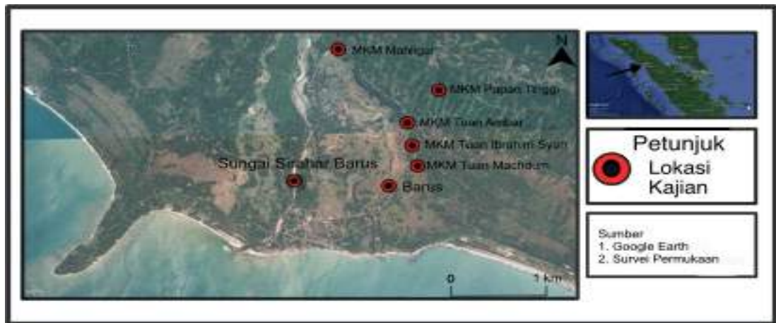
Peta 1.1 Lokasi Barus, Tapanuli Tengah, Sumatera Utara, Indonesia