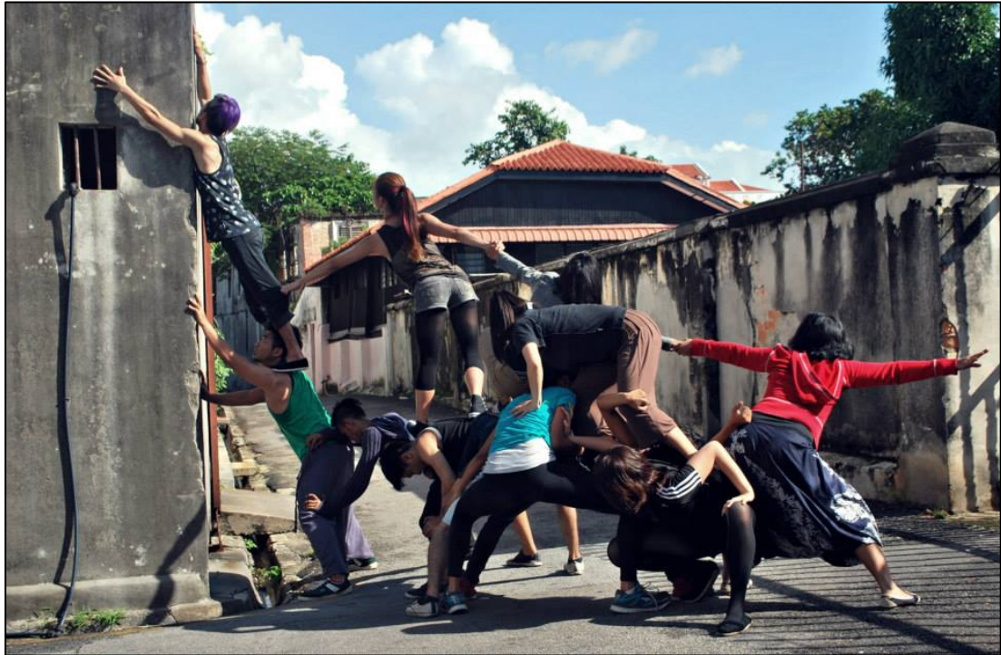
Rajah 1.1 Bridges & Kaki Lima (2013).