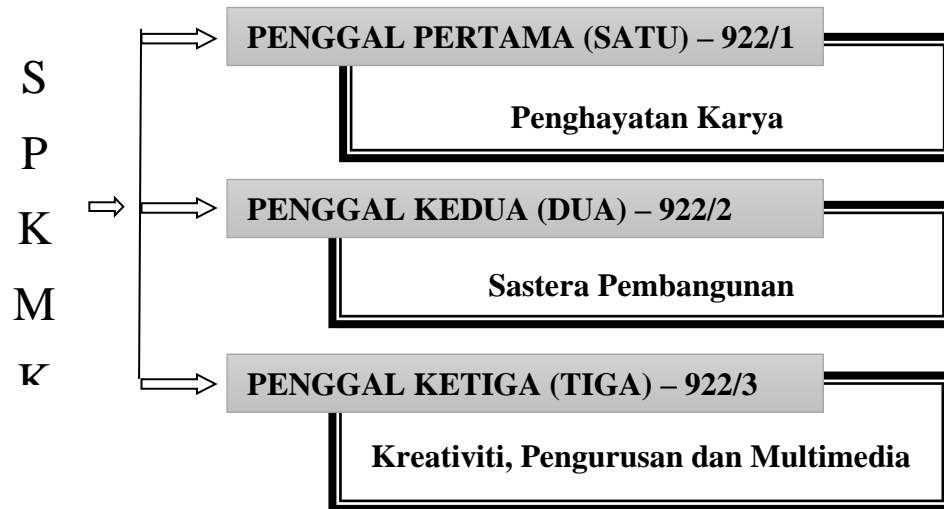
Rajah 1.1. Pembahagian Sukatan Pelajaran Kesusasteraan Melayu Komunikatif

kepada aspek penghargaan kerja, sastera dan pengembangan, kreativiti, pengurusan, dan multimedia seperti yang ditunjukkan pada gambar 1.1.