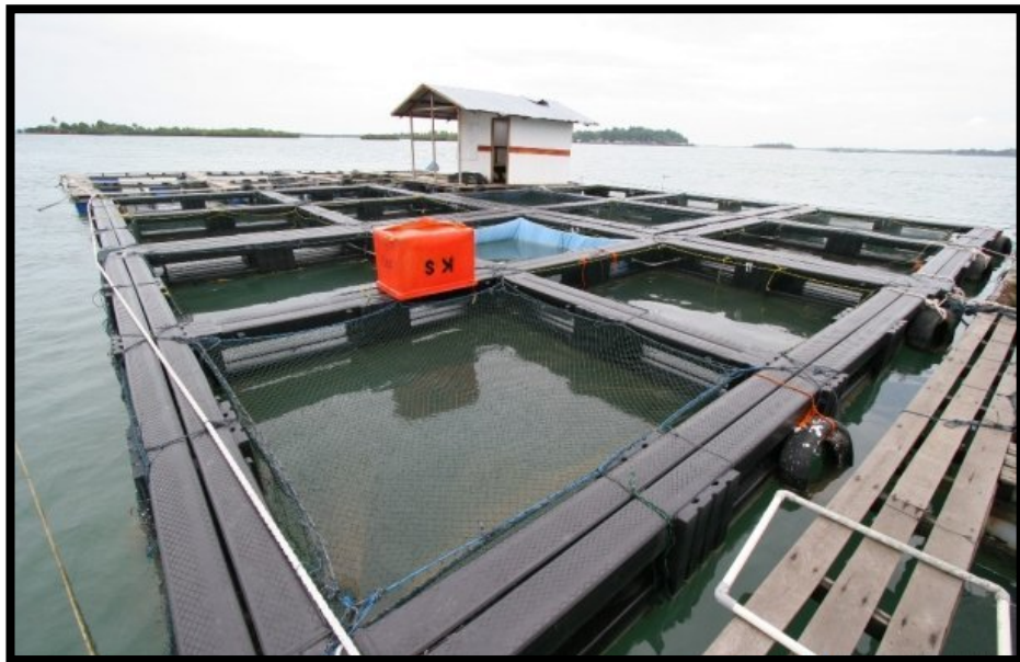
Rajah 2.3 Rumah Sangkar Terapung

sistem ternakan yang menggunakan sangkar atau kepungan untuk menternak hidupan akuatik. Kedua-dua jenis sistem akuakultur boleh menghasilkan produk yang berbeza kerana semua jenis-jenis ternakan bergantung kepada kondisi dan persekitaran yang berlainan (Intan Sharil, 2018). Sebagai contohnya, ikan keli perlu diternak di kawasan yang kurang air seperti kolam kerana kondisi habitatnya berlumpur dan air tawar yang tenang. Hal ini berbeza dengan ternakan seperti ikan siakap yang memerlukan persekitaran air yang mengalir dan air masin misalnya di pinggir laut. Oleh sebab itu, bagi menternak ikan siakap, pihak pengusaha perlu membina rumah sangkar terapung (rujuk rajah 2.3) atau sangkar pegun.