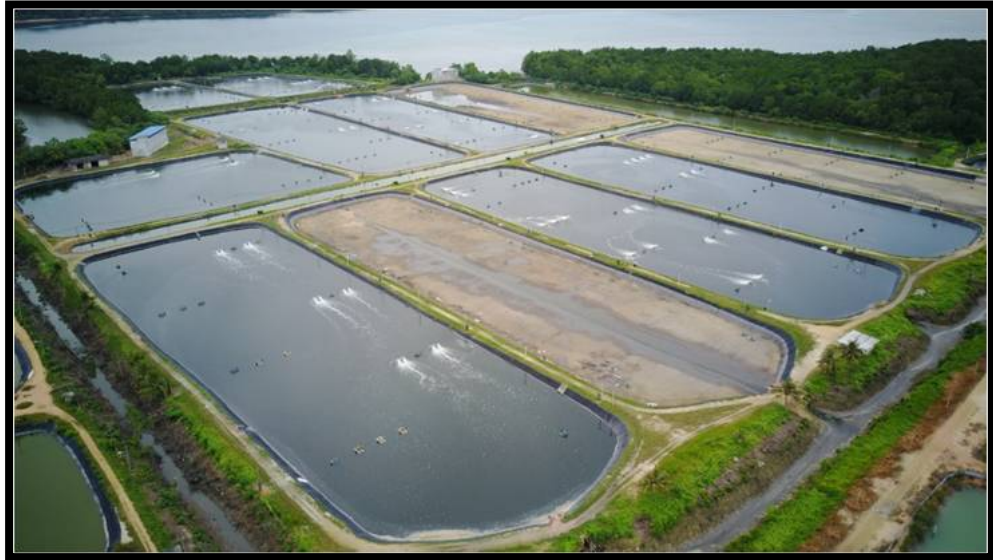
Rajah 2.1 Sistem Akuakultur Kolam

Sistem akuakultur terbahagi kepada dua sistem utama iaitu ternakan kolam tangkungan (rujuk rajah 2.1) dan juga sistem akuakultur ternakan terbuka di perairan seperti di pinggir pantai dan sungai.