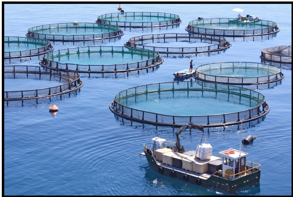
Rajah 2.2 Sistem Akuakultur Marin

Sistem akuakultur ternakan di perairan terbuka pula terbahagi kepada marin (rujuk rajah 2.2), air tawar dan air payau. Sistem akuakultur perairan terbuka ini merupakan