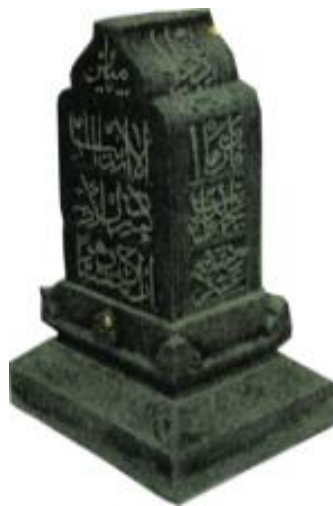
Foto 2.3 Makam Kg. Pemantang Pasir bertarikh 419 Hijriah/1028 Masihi

Nisan bertarikh 1028 Masihi dijumpai di Pekan Pahang, Malaysia. Bentuk dasar pipih dengan keempat sisi badan nisan terdapat inskripsi kaligrafi menggunakan khat tsulus namun tidak diketahui nama pemiliknya. Bahagian kepala nisan berbentuk menyerupai bawang (Foto 2.3). Bentuk nisan ini sama dengan nisan yang dijumpai di Aceh yang terdapat di Kompleks Imum Peut Ploh Peut, Samudera Pasai, Aceh Utara. Tetapi Othman dan Halim (1990) meragukan tarikh nisan ini, kerana jenis tulisan yang digunakan pada nisan ini lebih moden. Nisan ini telah dibaca inskripsinya oleh ahli epigrafi Tuan Haji Abdul Wahab bin haji Abdullah namun masih diperlukan kajian yang mendalam mengenai batu ini.