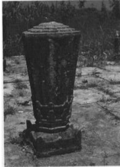
Foto 2.6 Nisan di Kampung Langgar Merbok, Kedah Malaysia tarikh 1179 Masihi

bentuknya hampir sama dengan nisan Aceh yang wujud sekitar abad ke 16 atau 17 Masihi. Bentuk nisan ini juga serupa dengan nisan yang ada di belakang Masjid Lebuah Aceh, George Town, Pulau Pinang yang dijangka mengandungi tarikh sekitar abad ke 18 Masihi.