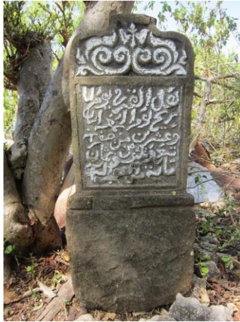
Foto 2.1 Nisan 1007 Masihi di tapak Lamreh dan inskripsinya.