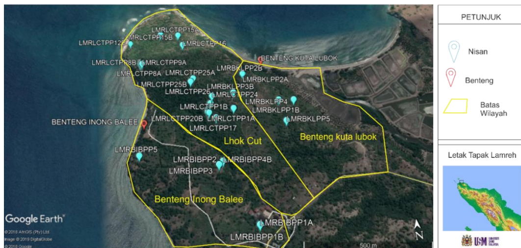
Peta 1.1 Peta tapak kajian Lamreh, Aceh Besar (Google Earth, 2019)

Lamreh adalah wilayah berbukit dan mempunyai tebing yang curam dengan bahagian atas yang rata menjadikannya sangat strategik untuk dijadikan sebagai pemukiman. Bukit Lamreh juga dapat dijadikan wilayah pertahanan dengan memanfaatkan tebing sebagai benteng semulajadi. Selain itu, terdapat juga sungai Krueng Lubok yang bermuara ke laut Selat Melaka. Letaknya bersebelahan dengan Benteng Kuta Lubok namun sungai ini tidak lagi berfungsi.