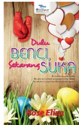
Dulu Benci Sekarang Suka