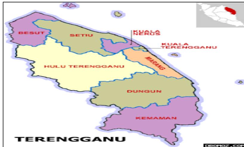
Rajah 1.2 Peta Negeri Terengganu