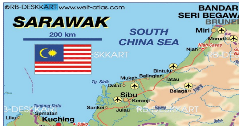
Peta 1.1 Bahagian ke 11 Mukah yang terletak berhampiran dengan bahagian Sibü, Sarikei dan Bintulu

Bahagian Mukah terletak di kawasan tengah Sarawak tetapi berhampiran dengan kawasan pesisiran pantai mengadap Laut China Selatan. Di bahagian timurnya bersempadanan dengan daerah Tatau di Bintulu dan selatannya pula ialah daerah Selangau di bahagian Sibü. Kawasan daratnya pula mempunyai kawasan tanah pamah dan gambut yang sesuai untuk bertanam dan pertanian. Kawasan tanah gambut berpaya juga menyebabkan tanaman rumbia hidup dengan subur dan menjadi asas ekonomi dan sumber makanan masyarakat tersebut. Kuala Batang Mukah bersambungan dengan laut dan menjadi tempat alir keluar masuk kapal dan perahu nelayan yang pergi ke laut mencari rezeki dan balik dengan pulangan laut. Ia dikatakan memudahkan urusan perikanan masyarakat Melanau. Selain itu, ia juga menjadi pintu keluar masuk kapal-kapal tangki minyak yang hendak dihantar ke Mukah. (Dzulfawati, 2006)