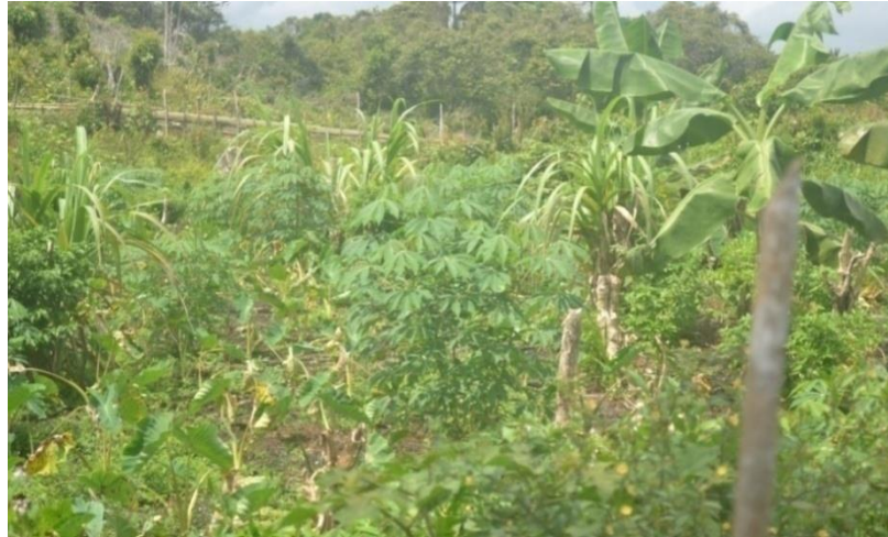
Rajah 2.1 Perladangan dengan tanaman tempatan di kampung kajian kes Fiane daerah Ayamaru

kacang tanah, bawang, dan hasil tangkapan ikan tasik, dengan pengeluaran dan pendapatan yang rendah atau tidak menentu. Pola perladangan yang dijalankan ini sebagai wujud kemusnahan persekitaran seperti dibentangkan daripada rajah dibahagian ini.