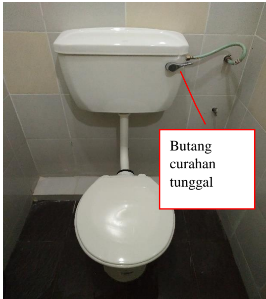
Gambar 2.1: Tandas jenis curahan tunggal