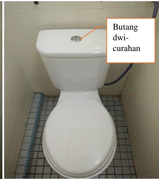
Gambar 2.2: Tandas jenis dwi-curahan

Suruhanjaya Perkhidmatan Air Negara (SPAN) telah memperkenalkan pelabelan produk air berkesan SPAN (SPAN, 2011). Pelabelan produk ini merupakan salah satu strategi pengurusan permintaan air. Ia bertujuan untuk menggalakkan penggunaan peralatan yang menjimatkan air untuk mengurangkan penggunaan air negara. Antara peralatan ini termasuk pancuran mandi (kepala pancuran, pemegang kepala pancuran, sistem pengawalan), peralatan paip (pili air, singki, pili berbibir, dan peralatan mencampur), sistem tandas (tandas dwi-curahan), mesin basuh serta mesin cuci pinggan-mangkuk. Langkah ini juga dilaksanakan oleh agensi air negara Singapura untuk mengawal dan mengurang penggunaan air domestik. Selain itu, pemasangan alat penuai air hujan juga digalakkan di perumahan untuk menggunakan air hujan sebagai sumber air alternatif (Teo, 2011).