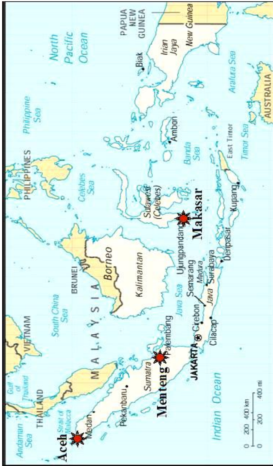
Peta 3 : Kedudukan Wilayah Syair-Syair Perang yang Dikaji