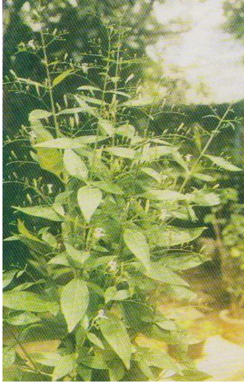
Rajah 2.1: Pokok A. paniculata (Hempedu Bumi)