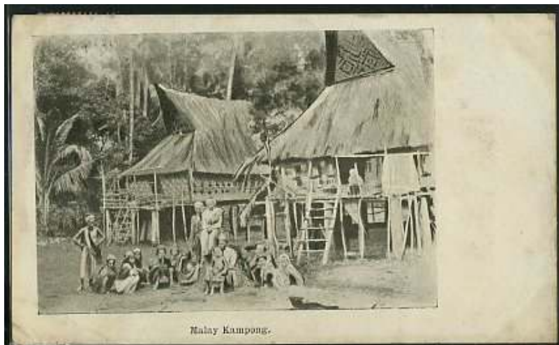
Rajah 1.4 : Wajah Kampung Melayu Yang Di Ambil Dari Sekeping Poskad Lama.