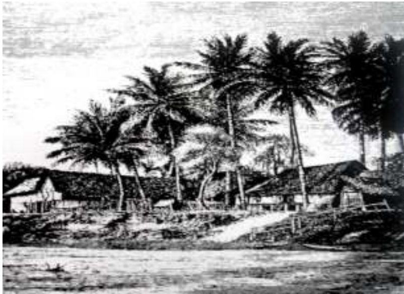
Rajah 1.3 : Suasana Perkampungan Melayu Di Tebing Sungai Perak.