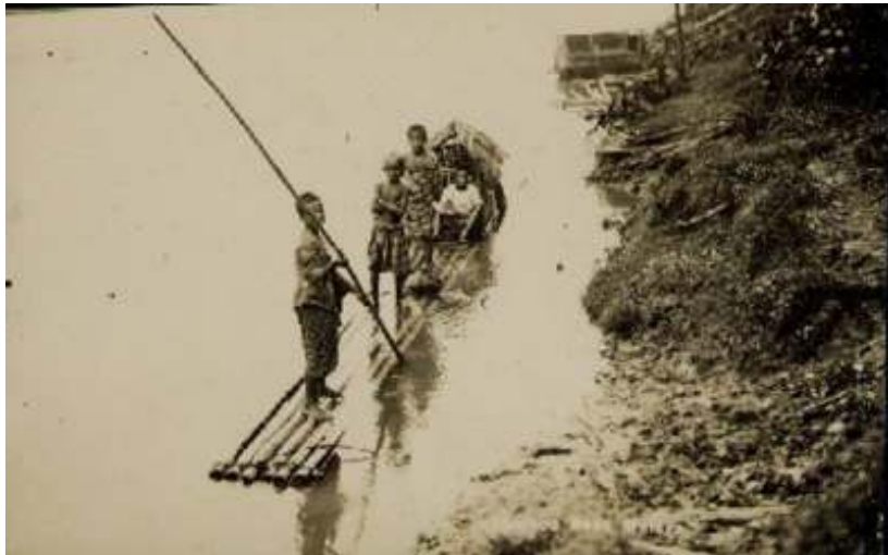
Rajah 1.2 : Berakit Antara Kegiatan Penduduk Awal Di Tebing Sungai Perak.

Jelas terbukti bahawa sejak dari dahulu, sungai merupakan nadi utama kepada kewujudan sebuah kota pemerintahan Melayu lama. Ini kerana kawasan tebing sungai sering menjadi pilihan utama sebagai pusat kegiatan penduduk untuk melakukan sebarang aktiviti atau upacara. Contohnya, pasar dan masjid dibina berhampiran dengan kawasan jeti yang menjadi tempat persinggahan dan nodus operandi perahu, kapal dan jentera pengangkutan air untuk melakukan aktiviti berkaitannya yang juga dikenali sebagai pengkalan.