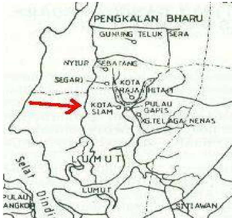
Rajah 1.7 : Kerajaan Gangga Negara Yang Wujud Sejak Kurun Ke 11 Antara Kota Lama Yang Wujud Di Perak.