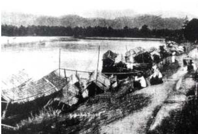
Rajah 1.1 : Sungai Perak Pernah Menjadi 'Lebuh Raya' Di Negeri Perak.

Sungai Perak ialah sungai yang terpanjang di negeri Perak dan berfungsi sebagai sempadan atau garisan untuk menandai teritori sesuatu tempat. Dari sudut perspektif geografinya, di sepanjang lembah Sungai Perak, bermula dari hulu Perak yang bersempadankan Thailand, terdapat suatu lembah sungai yang luas yang menjadi tempat masyarakat menjalankan aktiviti mereka di sungai.