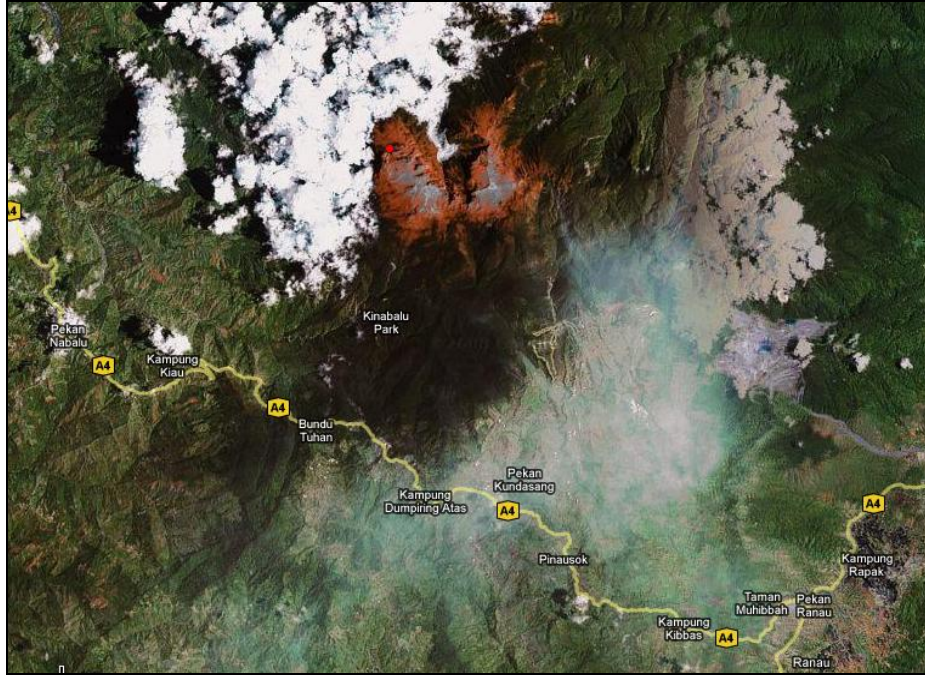
Peta 1.2 Kedudukan Taman Kinabalu dan petempatan penduduk berdekatan.