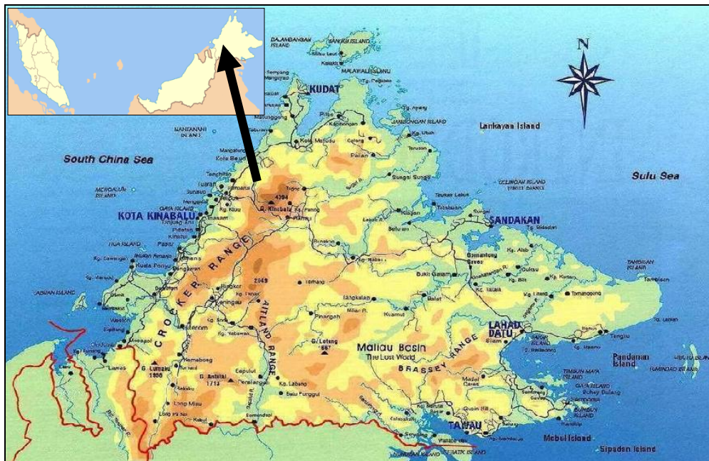
Peta 1.1 Negeri Sabah. Peta kecil menunjukkan kedudukan Sabah di Malaysia.

Berasaskan pendekatan oleh Ap & Crompton (1998), taraf hidup boleh ditentukan skalanya. Skalanya boleh dilabelkan sebagai faktor sosial dan budaya, pembangunan ekonomi, kualiti alam sekitar, perkhidmatan kerajaan tempatan dan negeri, kos sara hidup, sikap komuniti tempatan, kesesakan dan ketepuan. Cabaran utama kajian ini ialah untuk memahami istilah taraf hidup mengikut apa yang dirasai oleh penduduk tempatan yang tinggal di tengah Banjaran Crocker pada aras ketinggian melebihi 4,000 meter dari aras laut (Peta 1). Memandangkan bilangan pelancong yang datang ke taman ini mencecah 2,300,428 orang pada tahun 2008 sahaja dan 1,104,903 orang sehingga Jun 2009; impak yang dirasai oleh penduduk tempatan pasti akan menjadi fokus banyak