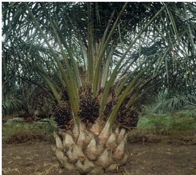
Gambarfoto 2.2: Pokok kelapa sawit yang tumbuh di Malaysia