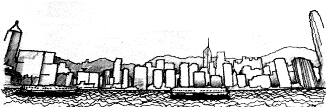
Lakaran 2.1: Kombinasi elemen semulajadi dan elemen buatan manusia bagi latar langit Hong Kong.

Hong Kong (Lakaran 1.1) adalah contoh terbaik untuk menjelaskan kandungan definisi latar langit ini khususnya dari aspek fizikal yang menunjukkan pembentukannya adalah hasil daripada kombinasi individu atau kelompok elemen semulajadi dan elemen buatan manusia. Turut memiliki elemen sempadan yang jelas di bahagian hadapan, ia memberi impak visual positif kepada paparan latar langit Hong Kong sekaligus mempermudah proses penterjemahan terhadapnya.