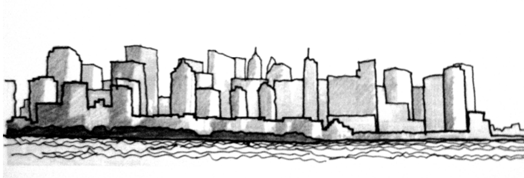
Lakaran 2.4: Latar Langit Manhattan, New York

Merujuk kepada Manhattan, New York (Lakaran 2.4) pula, ia adalah sebuah bandaraya kaya dengan keunikan bangunan-bangunan pencakar langit yang memiliki nilai budaya dan sejarahnya tersendiri. Keunikan ini turut memaparkan integrasi bandarayanya bersama kebijaksanaan mereka dalam memanipulasikan skala perancangan pembangunan. Bermula awal abad ke-18, skala perancangan pembangunan ini telah menghasilkan sebuah bandaraya yang memaparkan identiti unik kerana kelompok bangunan pencakar langitnya membentuk bayangan aturan kotak-kotak gergasi.