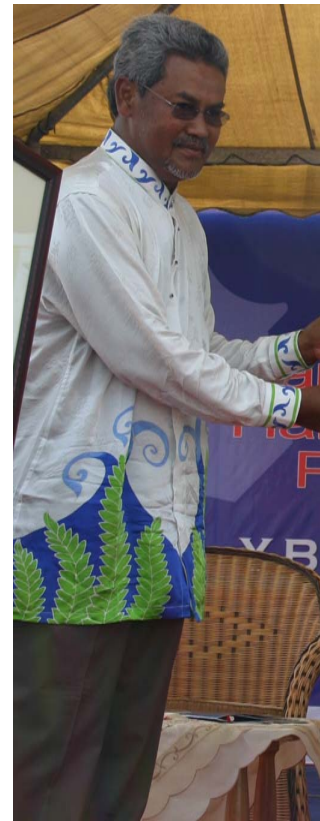
Rekabentuk baju Batik AJK Induk Sambutan HMPK 2006