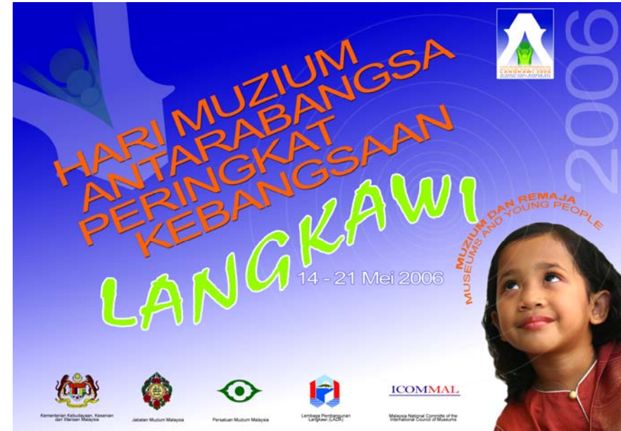
Poster & Jadual