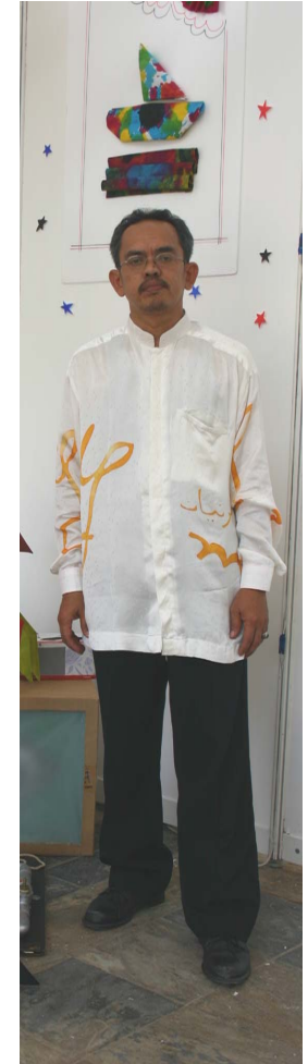
Rekabentuk Baju Batik M&G USM