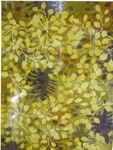
Rimbun (2006) Batik atas sutera/ batik on silk 112 cm x 250 cm