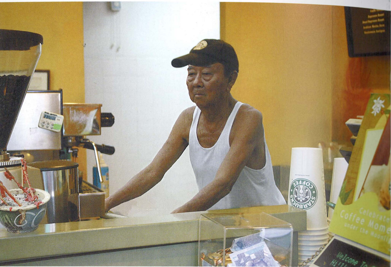
Montage 1 (2007) Cetakan digital atas kanvas / Digital Print on canvas 130 cm x 87 cm

Karya-karya kolaj digital Tetriana Ahmed Fauzi mencadangkan bahawa persekitaran kita yang penuh dengan imajan-imajan kini telah menjadi lapangan pertembungan dalam mana pelbagai budaya, gaya hidup dan identiti boleh dirombak dan dibina-semula. Karya-karya beliau memantulkan interpretasi semiotik pasca-strukturalis. Interpretasi ini mengusulkan bahawa kita kini hidup dalam dunia yang maknanya tidak pernah kekal dan sentiasa berubah.