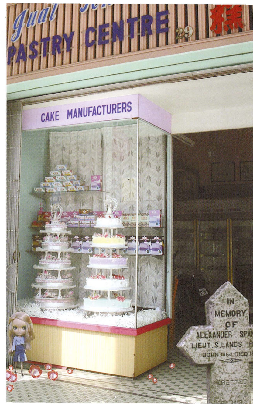
Montage 11 (2007) Cetakan digital atas kanvas / Digital Print on canvas 112 cm x 68 cm

Such endless possibilities unveil the fact that we are living in a multidimensional world of overlapping contexts. Sometimes the contexts compliment each other to provide us with a coherent reality. Often times, especially in today's age of globalization, liberal free market economy and information technology, they may contradict, cancel, deconstruct, or even construct (albeit temporarily) new realities. The burden is placed on the viewers (or readers) of images to engage with them and put them to work (to read them with new insights, different from their original contexts).