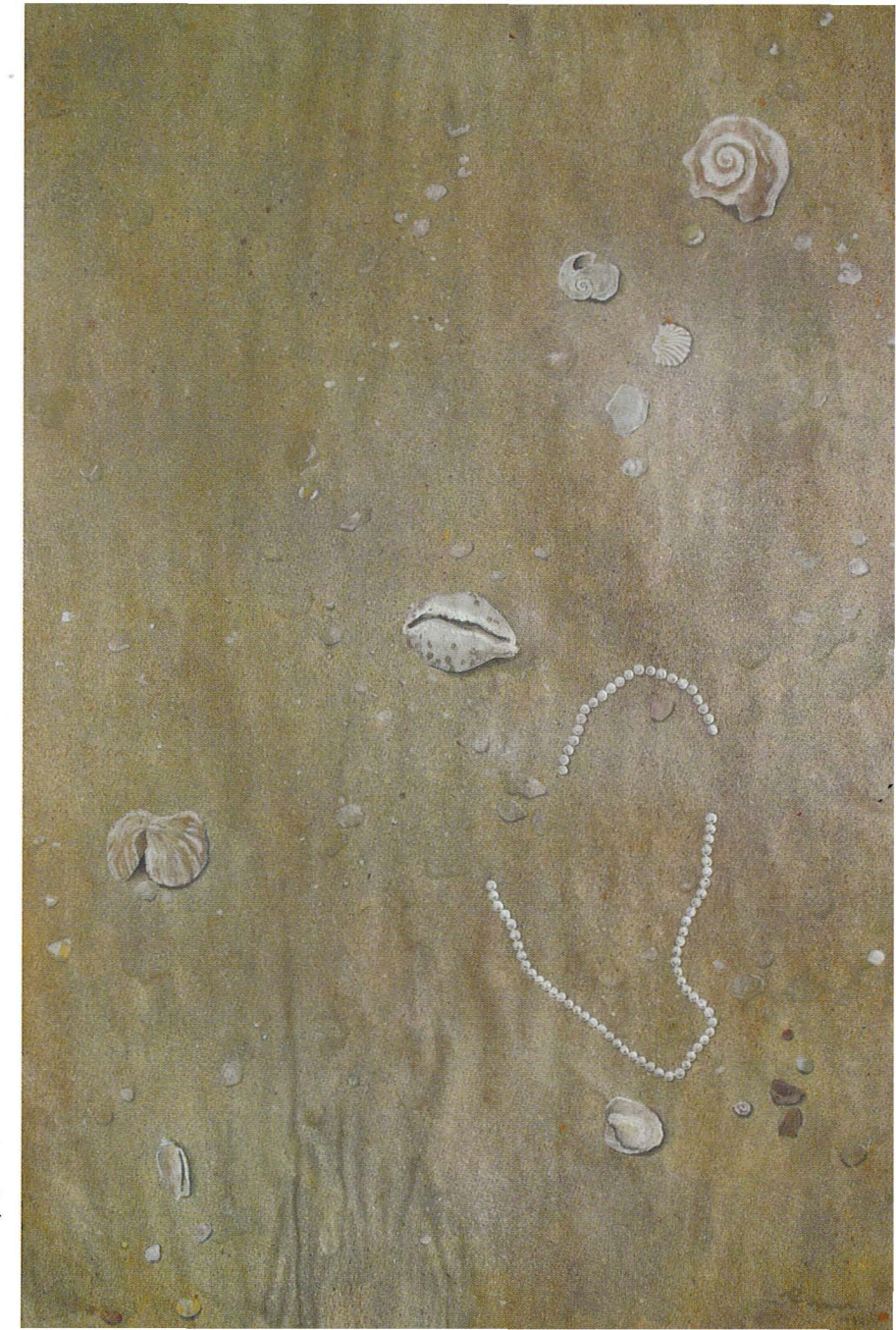
Hantaran Tak Berdulang 2 (1994) Akrilik atas kertas / Acrylic on paper 65 cm x 96 cm

The angle she chooses induces a sense of looking down at a plane or ground from above. The slightly enlarged size or relative scale of her subjects suggests a rather intimate and attentive observation, as if one is looking down from a squatting position. One may refer to this as a rather 'down-to-earth' point of view, with the subjects scattered in a seemingly random manner but yet equal in their