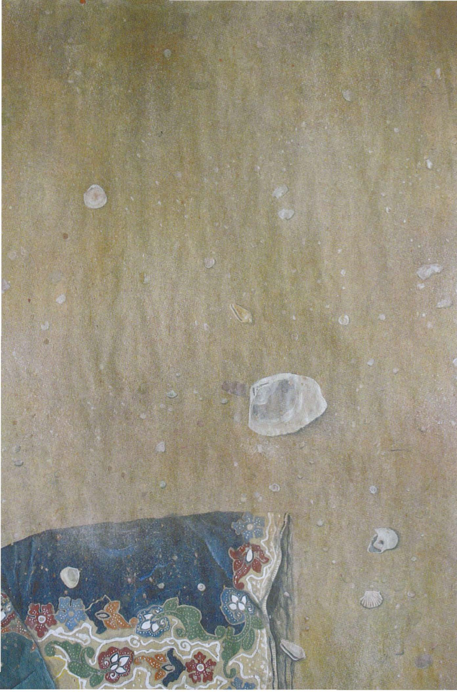
Hantaran Tak Berdulang (1994) Akrilik atas kertas / Acrylic on paper 65 cm x 96 cm

Rozana menangani subjek-subjek beliau sebagai sumber komposisi penggambaran dan juga untuk tujuan simbolik dan permainan semiotik. Dari satu segi, beliau menggetarkan kombinasi antara penafsiran 'bio-mimicry' Nusantara dengan realisma Barat terhadap alam semulajadi. Kombinasi ini bertujuan merakamkan kedua-dua aspek lokal dan kosmik pada aturan alam semulajadi, gabungan kedua-dua ketrampilan fizikal dan abstrak pada alam semulajadi. Karya-karya beliau menempiaskan udara puitis naratif peribadi yang berlingung disebalik kod-kod simbolik dan semiotik. Beliau berbicara menerusi bisikan metafora-metafora ringkas yang mencerminkan kehalusan dan ketertiban tradisional Melayu. Suara beliau berlapis. Beliau akur pada adab dalam kehalusan artistik Melayu - benar, cantik dan baik.