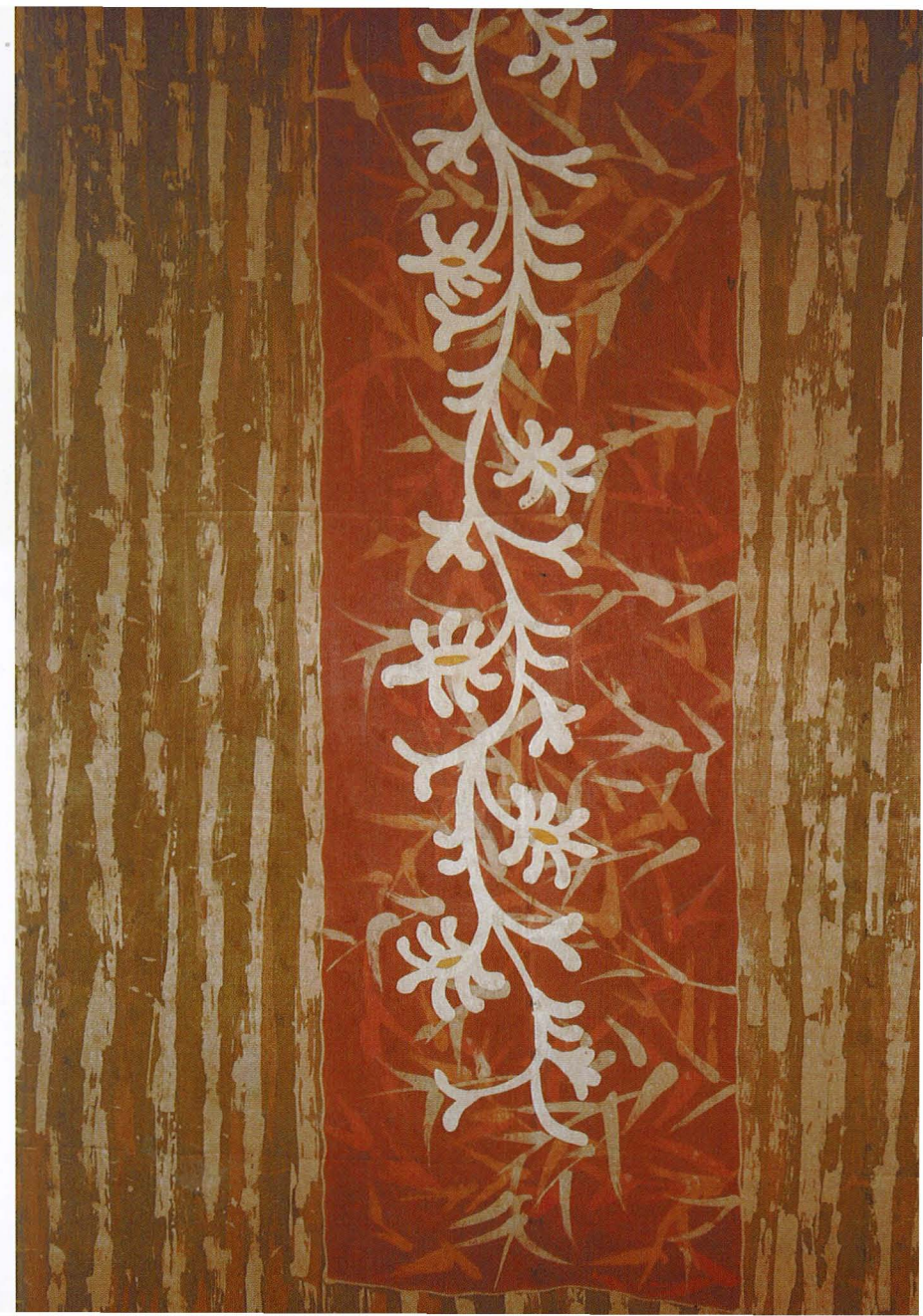
Susur (2006) Batik atas sutera/ Batik on silk 112 cm x 250 cm