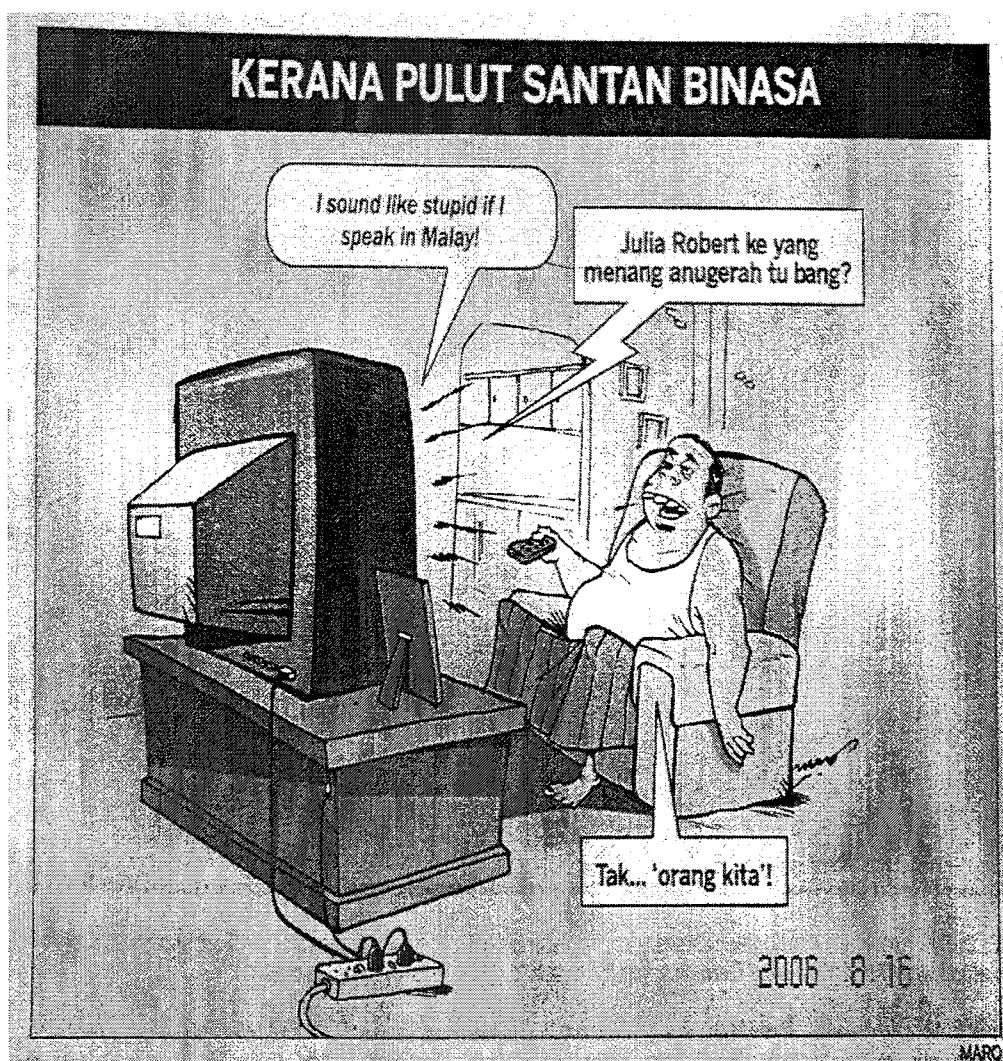
GAMBAR 1 : KOSMO 16 Ogos 2006