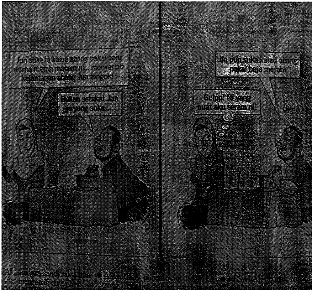
GAMBAR 3 : KOSMO 15 Ogos 2006