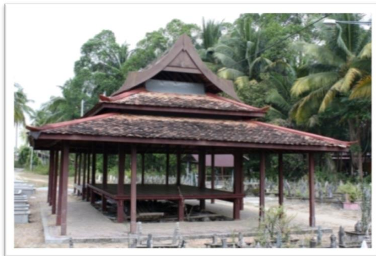
Gambar 4 Wakaf Tok Selehor, Kok Pasir, Tumpat, Kelantan.

Wakaf yang berasal dari Kelantan, Terengganu dan selatan Thai cukup mudah dikenali melalui reka bentuk senibina dan perabung yang menggunakan atap singgora. Selain masyarakat Melayu, senibina wakaf juga dibina oleh kaum Cina dan Siam terutama di kawasan pedalaman di negeri Kelantan dan Terengganu.