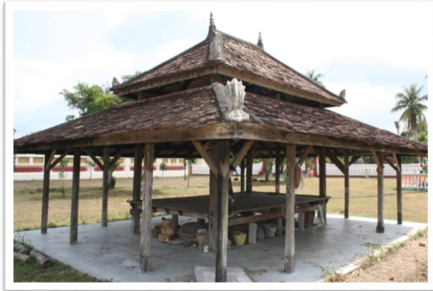
Gambar 7 Wakaf Siam, Wat Chomprachthumthactchanaram.

Wakaf Siam seperti dalam Gambar 7 mempunyai reka bentuk yang hampir menyamai dengan wakaf milik orang Melayu namun terdapat sedikit perbezaan dari segi dekorasi yang menghiasi seni bina wakaf mereka. Menurut Echot Chan Chan, wakaf dalam masyarakat Siam dibina dengan tiga objektif iaitu untuk memperingati atau puja datuk nenek yang telah meninggal dunia, Sumbangan yang berupa amal jariah bagi penganut agama Buddha kepada ketik, Tempat berehat, berkumpul, dan berdiskusi.