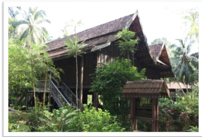
Gambar 2 Istana Tengku Nik atau juga dikenali Rumah Tele.

Istana merupakan rumah kediaman rasmi raja dan keluarganya, reka bentuknya menampilkan kemewahan dan berskala besar. Istana juga berfungsi sebagai agensi yang bertanggungjawab dalam urusan pentadbiran, kewangan dan juga majlis-majlis rasmi dan tidak rasmi. Negeri Kelantan dan Terengganu masih mempunyai istana tradisi kayu yang kini dibawah seliaan Muzium Negeri masing-masing. Istana-istana tradisi sehingga kini masih mengekalkan identiti senibina tradisi berbumbungkan atap singgora. Antara istana tradisi yang terkenal dari Terengganu ialah Istana Satu; Tengku Maziah, Istana Tele atau Istana Tengku Nik, Istana Tengku Anjang dan Istana Tengku Long. Manakala istana beratap singgora dari Kelantan ialah Istana Jahar kini dijadikan Muzium Adat dan Istiadat Di-Raja dan Istana Balai Besar.