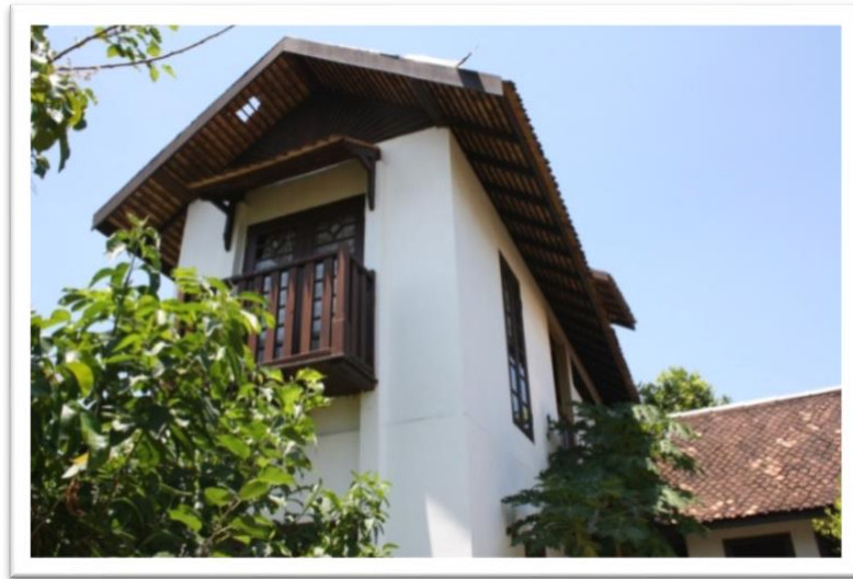
Gambar 8 Rumah dua tingkat bersambungan dengan ruang dapur.

Dalam kawasan rumah kediamannya, terdapat galeri Wanpo, bengkel ukir kayu, dan pejabat seperti yang ditunjukkan dalam Gambar 8. Beliau telah membuat renovasi iaitu dengan menambah ruangan kediaman dan bahagian dapur bersambungan dengan rumah lama milik arwah ayahnya. Reka bentuk rumahnya menggabungkan gaya kontemporari Inggeris dan tradisi Melayu dihasilkan oleh syarikat senibina milik anak-anaknya beliau. Gambar 9 menunjukkan atap dibina menggunakan atap singgora yang dibeli dari perusahaan kampung Pengkalan Baru, Bachok, memandangkan di Terengganu tidak ada pengusaha atap singgora. Wanpo juga turut menyuarakan tentang kelemahan atap singgora terutamanya daripada segi ketahanan fizikal. Atap singgora mudah pecah dan beralih kedudukan sekiranya ditiup angin kencang.