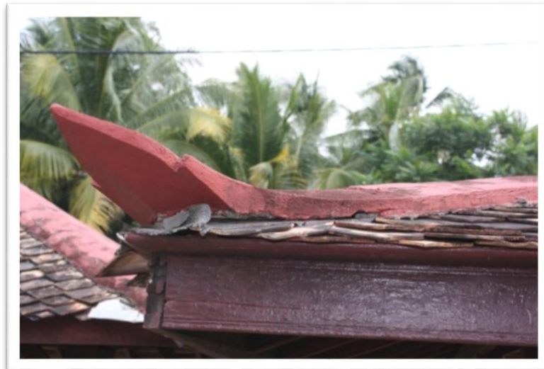
Gambar 6 Ekor Itik.

Wakaf Tok Selehor telah didirikan pada sekitar tahun 1920 dan ia masih kekal teguh berdiri di kawasan perkuburan Islam Kampung Kok Pasir. Seni bina wakaf ini mempunyai bumbung bertingkat tiga. Penutup bumbung wakaf menggunakan atap singgora. Bumbung paling atas iaitu tingkat tiga, mempunyai sepasang pemeleh pada bahagian tepi bumbungnya seperti yang ditunjukkan dalam Gambar 5. Manakala, bumbung tingkat satu dan dua mempunyai hiasan ekor itik pada setiap penjuru. Reka bentuk ekor itik yang melentik menghala ke awan, menjadikan seni bina wakaf ini bertambah menarik seperti yang ditunjukkan dalam Gambar 6.