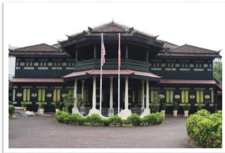
Gambar 3 Istana Jahar. Sumber: Shamsu Mohamad

Keindahan dan kehalusan seni bina Istana Jahar dapat dilihat pada keseluruhan reka bentuk, bahan dan teknik binaan yang digunakan. Atap singgora buatan Kelantan digunakan untuk menghiasi perabung bumbung istana. Menurut Datuk Salleh Mohd Akib (2012), atap singgora digunakan pada