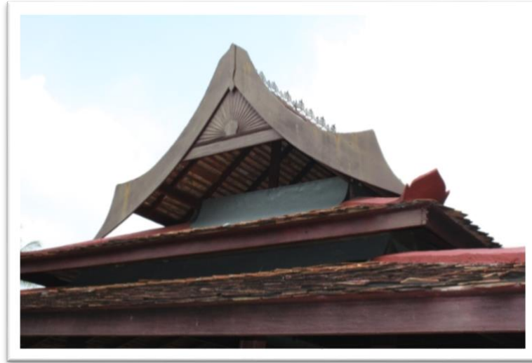
Gambar 5 Pemeleh dan Tebar Layar.

seorang ulama dan guru sekolah pondok di Kampung Selehor. Anak murid Tok Selehor bukan sahaja terdiri dari penduduk tempatan, malahan ada yang datang dari Palembang, Jawa, Kemboja dan Patani.