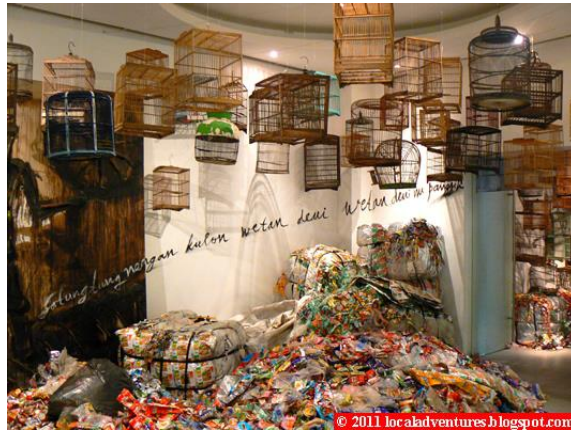
Gambar 1. Cigondewah Art Project by Tisna Sanjaya show at NUS Museum, Singapore

Sampah yang dikumpulkan dari sungai Cigondewah di Bandung Barat. Cigondewah merupakan proyek penyadaran tentang akibat kecerobohan perilaku yang dapat merusak bumi tempat kita berpijak.