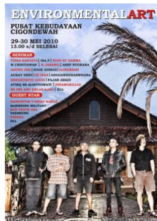
Gambar 3. Salah satu poster kegiatan “Environmentalart” di Pusat Kebudayaan Cigondewah, Bandung.

Sebuah contoh lain dari solusi inovatif seni dan budaya dalam memberdayakan kaum marjinal, dalam hal ini adalah kaum disabilitas adalah apa yang dilakukan oleh YAKKUM (Yayasan Kristen untuk Kesejahteraan Umum) di Yogyakarta. Yakkum adalah yayasan non pemerintah yang merupakan