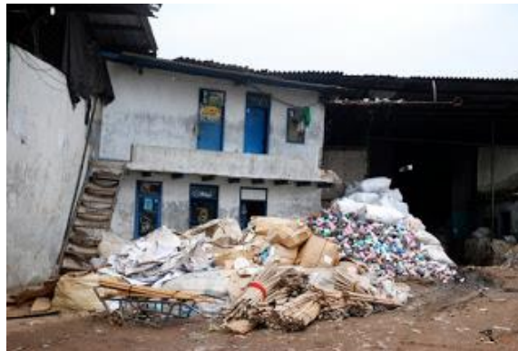
Gambar 2. Salah satu sudut kawasan Cigondewah

Sampah yang dikumpulkan dari sungai Cigondewah di Bandung Barat. Cigondewah merupakan proyek penyadaran tentang akibat kecerobohan perilaku yang dapat merusak bumi tempat kita berpijak.