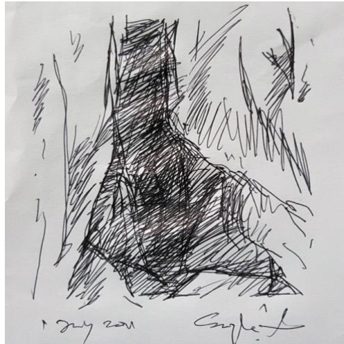
Lakaran 3. Ruang dalam gua.