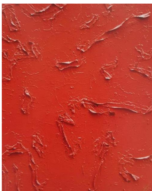
Imej 11. Camouflage (2011). Medium: akrilik, cat minyak dan kolaj atas kanvas.

Pada hari ini penggunaan teknologi boleh membantu para pelukis untuk mencari komposisi yang menarik dengan cara yang cepat. Bagaimana pun, Suzlee selesa dengan kaedah konvensional iaitu melihat melalui gerak rasa dan minda. Suzlee merancang dan menilai komposisi yang dihasilkan melalui perletakan warna pada kanvas. Warna-warna yang digunakan akan menghasilkan ruang dan seterusnya membawa audien 'masuk merasai pengalaman' yang dipaparkan berdasarkan komposisi, warna dan jalinan pada permukaan karya. Dalam hal menentukan 'pergerakan arah' dalam komposisi, Suzlee tidak menetapkan apa-apa panduan. Ini adalah kerana abstrak ekspresionis adalah catan yang bersifat spontan. Oleh itu 'pergerakan arah' samada dari teknik sapuan berus, perletakan warna mahupun jalinan semuanya berlaku mengikut 'gerak rasa' dan secara spontan dan yakin.