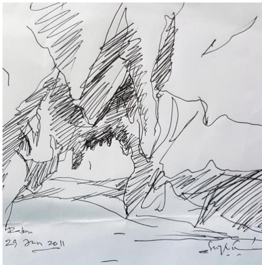
Lakaran 2. Pintu masuk Gua Kota Gelanggi

Kebiasaannya, walaupun Suzlee menghasilkan karya berbentuk abstrak, lakaran-lakaran awal yang dilukis masih berdasarkan rujukan sebenar, namun ianya lebih ringkas dan menggunakan garisan sahaja. Ini adalah kerana faktor kekangan masa, tempat dan ruang yang terbatas. Namun demikian, lakaran awal masih menunjukkan gambaran yang dikenali seperti bentuk gua, jalinan pada dinding gua dan ruang gelap yang menunjukkan kedalaman sesebuah gua (Lakaran 3 dan 4). Lakaran awal ini dapat membantu pelukis ketika berkarya di dalam studio, mengingat kembali suasana dan mood persekitaran, juga pengalaman yang ditempuhi pada masa itu. Kebiasaannya, lakaran-lakaran ini akan di tampal memenuhi dinding-dinding studio supaya memudahkan pelukis untuk merasai semula emosi beliau ketika melukis lakaran yang lebih menjurus kepada penghasilan karya berbentuk abstrak.