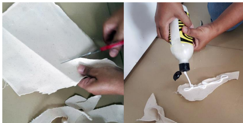
Imej 6.

Berdasarkan lakaran yang dihasilkan pelukis mula membentuk komposisi di atas kanvas dengan menggunakan potongan kanvas. Potongan-potongan kanvas dipotong berbagai rupa untuk menghasilkan rupa yang berlainan bentuk dan saiz di atas kanvas (Imej 6).