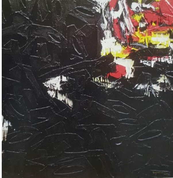
Imej 12. Black Cave , akrilik, cat minyak dan kolaj atas kanvas.

Hasil dari ekspedisi ini Suzlee berjaya mengadakan Pameran Solo Siri The Kingdom pada 6-18 Januari 2012 di Pinkguy Gallery, Kuala Lumpur. Antara karya-karya yang dipamerkan ialah Black Cave (Imej 12), Embers (Imej 13), Golden City dan Dreamlands .