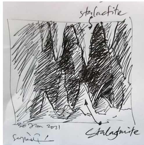
Lakaran 4. Stalagtite dan stalagmite dalam gua.