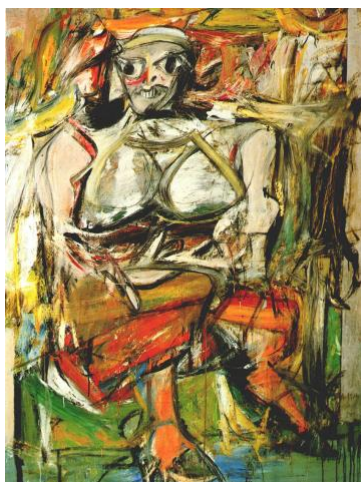
Imej 1. Willem de Kooning, Woman 1 (1950-52).

Di antara karya awal de Kooning ialah potret isterinya Portrait of Elaine (1940-41). Bergerak dari catan yang berbentuk realist, de Kooning menghasilkan karya berbentuk separa abstrak Woman (1944). Kemudian, dalam karya Woman 1 (1950-52, Imej 1) de Kooning telah memecah figura asal menjadi karya abstrak dengan figura yang hampir hilang bentuk asalnya (Zilczer, 2015). De Kooning mengambil masa yang panjang untuk menghasilkan Woman 1 . Bagi menghasilkan karya tersebut, proses melukis, memadam dan melukis kembali berulang kali di atas kanvas yang sama. Wajah kaku dengan mata terbeliak dengan bentuk badan yang asing telah mendapat kritikan negatif daripada pengkritik seni. Namun de Kooning tidak menghiraukan kritikan tersebut kerana kritikan-kritikan itu bertentangan dengan prinsip pelukis aliran Abstrak Ekspresionisme. Semakin lama, gaya ekspresionis semakin terlihat dalam karya-karya de Kooning. Di antara karya-karya de Kooning yang tiada mempamerkan sebarang imej ialah North Atlantic Light (1977) dan Pirate (Untitled II, 1981).