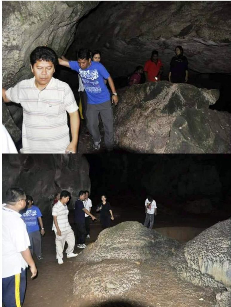
Imej 4. Pelukis bersama rakan-rakan dalam Ekspedisi Gua Kota Gelanggi.