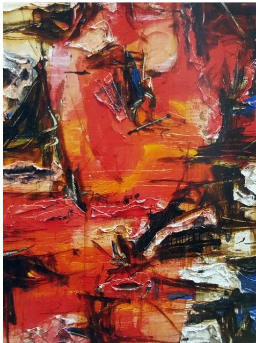
Imej 13. Embers (2011). akrilik, cat minyak dan kolaj atas kanvas.