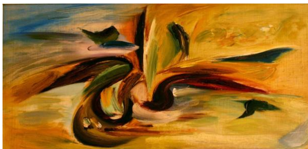
Imej 2. Syed Ahmad Jamal, Tulisan (1964). Sumber: Mohamed Ali Abdul Rahman (2000)