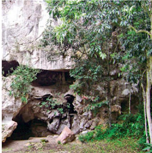
Imej 3. Gua Kota Gelanggi. Pandangan dari luar gua.