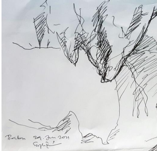
Lakaran 1. Persekitaran Gua Kota Gelanggi