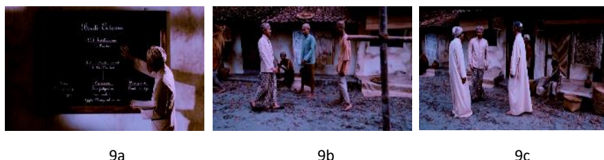
Gambar 9. Rasionalitas kyia kafir

Pada scene-scene berikutnya, tampak sutradara kian mengisi narasi dengan berbagai upaya eksekusi atas rasionalitas, keteguhan dan kearifan sosok Ahmad Dahlan. Sebagai contoh dapat dilihat pada adegan saat Dahlan memutuskan bergabung dengan Budi Utomo. Selanjutnya Dahlan mengajar di kelas Government , mendirikan Madrasah dengan pengajaran modern, serta menanggalkan kostum gamis dan menggantinya dengan beskap layaknya kaum priyayi (kejawen) ( scene 9a). Ia pun langsung dijuluki sebagai kyiai kafir. Scene 9b, dan 9c mengetengahkan adegan bagaimana Dahlan yang berkostum beskap dicemooh oleh masyarakat maupun ulama lain. Namun dengan bekal kearifan, keyakinan serta wawasan pengetahuannya, Dahlan tetap melangkah dengan pendiriannya. Dari scene dan penceritaan sedemikian, maka menandakan bahwa Dahlan berada dalam ruang dan waktu sosiokultur masyarakat Jawa muslim masa itu yang fanatik. Sebagai masyarakat yang masih terbelenggu oleh cara pandang dangkal terhadap segala sesuatu perbedaan dan perubahan. Segala