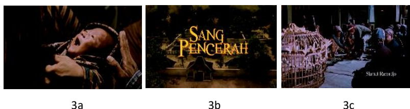
Gambar 3. Prosesi kelahiran dan ritual tidak siten .

Gambar 3. merupakan rangkaian scene babak permulaan yang mengetengahkan adegan prosesi kelahiran sampai dengan upacara (selamatan) tidak siten yang dilaksanakan dalam tradisi (upacara) yang berbau mistik. Mencermati tata properti di sana - seperti: ruang, kostum, perangkat upacara, sesajen, dan kerumunan kerabat – maka hal ini mampu dimaknai sebagai penanda bahwa keluarga Ahmad Dahlan termasuk sebagai keluarga Jawa dari kalangan yang berkecukupan dan terpandang untuk ukuran masyarakat saat itu. Di samping itu tampak bahwa setting dihadirkan di dalam rumah. Dengan demikian hal ini dapat dimaknai sebagai penanda bahwa ruang privat keluarga Ahmad Dahlan berada dalam ruang budaya Jawa. Terkait dengan penataan cahaya, tampak cahaya pada scene 3a diarahkan terutama pada raut wajah si bayi. Raut wajah bayi menjadi bersinar di tengah latar pencahayaan redup yang berangsur pekat pada keseluruhan frame . Visualisasi ini tampaknya bukan sekedar gambaran suasana malam hari sebagai waktu nyata (sesuai sejarah) tepatnya Ahmad Dahlan dilahirkan. Dari perspektif semiotika Peirce, sosok bayi adalah ikon. Sedangkan cahaya latar redup berangsur pekat sedemikian adalah indeks dari kehidupan masyarakat Yogyakarta saat itu yang miskin, menderita, baik secara sosial, budaya, maupun spiritual. Cahaya terang pada raut wajah si