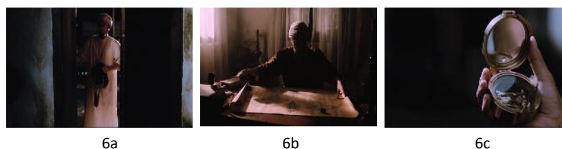
Gambar 6. Terusik arah kiblat

Gambar 6. merupakan beberapa scene yang mengetengahkan adegan pada saat Dahlan mulai terusik dengan arah kiblat yang diacu di mesjid-mesjid di Kauman. Setelah mempelajarinya, ia pun mengusulkan perubahan arah kiblat. Namun usulan ini malah dianggap menyesatkan sebab dalam menentukan arah kiblat Dahlan menggunakan peta dan kompas, yang dianggap masyarakat saat sebagai buatan kafir.