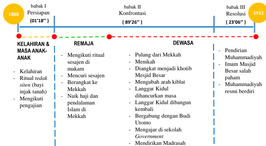
Gambar 2. Struktur alur dan plot point film Sang Pencerah .

Pada Gambar 1. tampak bahwa peristiwa kelahiran menjadi fungsi cerita permulaan/persiapan) di babak I, dengan plot point kelahiran sampai dengan mengikuti pengajian. Babak ini berdurasi 1 menit 18 detik. Pada babak II, peristiwa ketika remaja dan dewasa berfungsi sebagai tahap