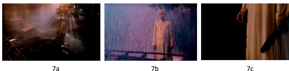
Gambar 7. Langgar Kidoel dihancurkan dan dukungan keluarga