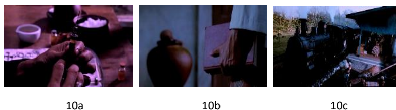
Gambar 10. Eksekusi rasionalitas

perbedaan lebih dipandang sebagai suatu ancaman, pembangkangan, yang lantas patut dibenci, dipinggirkan, dan disingkirkan.