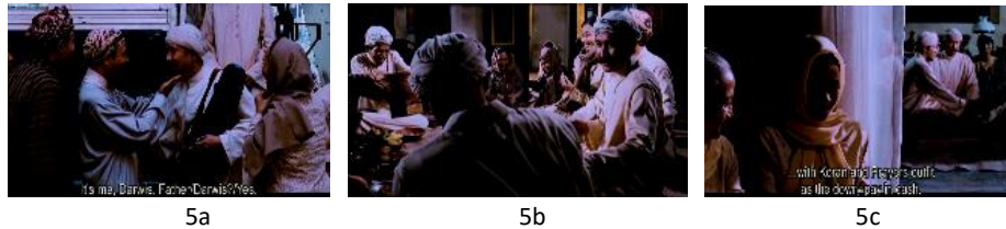
Gambar 5. Peristiwa ketika dewasa, kembali dari Mekkah dan pernikahan. Sumber: film Sang Pencerah , didokumentasi oleh penulis (2016)

keluarganya dari dari penjara konvensi zaman itu. Secara semiotik, tindakan Darwis keluar dari Yogyakarta pergi ke Mekkah adalah penanda kuat yang memiliki pesan demikian. Dalam kaitannya dengan ruang dan waktu, maka rangkaian plot point ini menandakan bahwa Ahmad Dahlan berada dalam ruang sosial budaya Jawa masa itu yang kehidupan beragamanya (Islam) lebih bernuansa takhayul, mistik, dan tindakan lain yang tidak rasional.