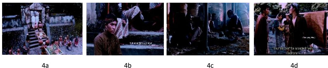
Gambar 4. Peristiwa ketika remaja