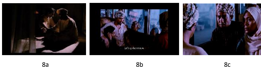
Gambar 8 . Keterpurukan dan dukungan keluarga

Selanjutnya Gambar 8. Merupakan rangkaian scene yang menengahkan adegan bagaimana sosok Ahmad Dahlan yang sedang dilanda keterpurukan. Pada scene 8a diketengahkan adegan ketika seorang paman sedang menyemangati dan memberi petunjuk pada Dahlan. Tampak di sana dua sosok (paman dan Ahmad Dahlan) yang sedang duduk bersila. Sosok Dahlan berada di posisi depan, serta sosok paman di belakangnya. Keseluruhan visualisasi dihadirkan dengan latar hitam pekat. Cahaya dengan nuansa kecoklatan tampak diarahkan pada sosok paman dan Ahmad Dahlan. Namun jika