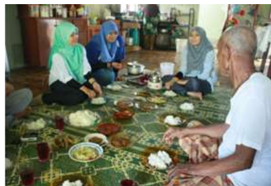
Gambar 1 Cara hidangan dan susun atur.

Kaedah Pemerhatian Turut Serta digunakan dalam untuk melihat cara makan, adab, peraturan ketika makan, jenis makanan dan permasalahan yang timbul semasa makan, terutamanya permasalahan yang timbul dari sudut rekabentuk pinggan makan yang digunakan. Data direkod dengan menggunakan rakaman video serta disokong dengan borang senarai semak.