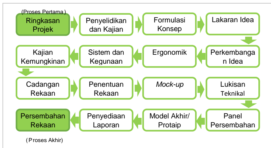
Gambarajah 1 Proses Rekabantuk (Shahriman, 2004).

Sepanjang proses melakar, beberapa lakaran idea telah dihasilkan bagi memastikan rekabantuk akhir dapat menepati kriteria-kriteria yang ditetapkan ketika formulasi konsep.