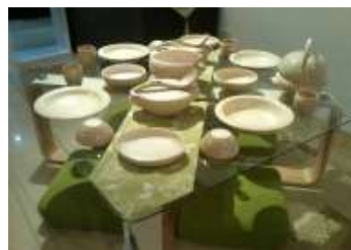
Gambar 5 Prototaip set pinggan mangkuk yang dihasilkan.

Produk pinggan mangkuk yang dihasilkan ini telah melalui proses rekabentuk (Gambarajah 1.0) yang turut melibatkan kreativiti, penyelesaian masalah dan inovasi. Penambahbaikan dari segi keberkesanaan penggunaan dan nilai estetika produk pinggan mangkuk pasaran turut dipertimbangkan ketika merekabentuk.