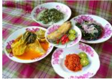
Gambar 2 Jenis makanan yang dihidangkan.