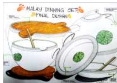
Gambar 4 Cadangan lakaran set pinggan makan.

Produk pinggan mangkuk yang dihasilkan ini telah melalui proses rekabentuk (Gambarajah 1.0) yang turut melibatkan kreativiti, penyelesaian masalah dan inovasi. Penambahbaikan dari segi keberkesanaan penggunaan dan nilai estetika produk pinggan mangkuk pasaran turut dipertimbangkan ketika merekabentuk.