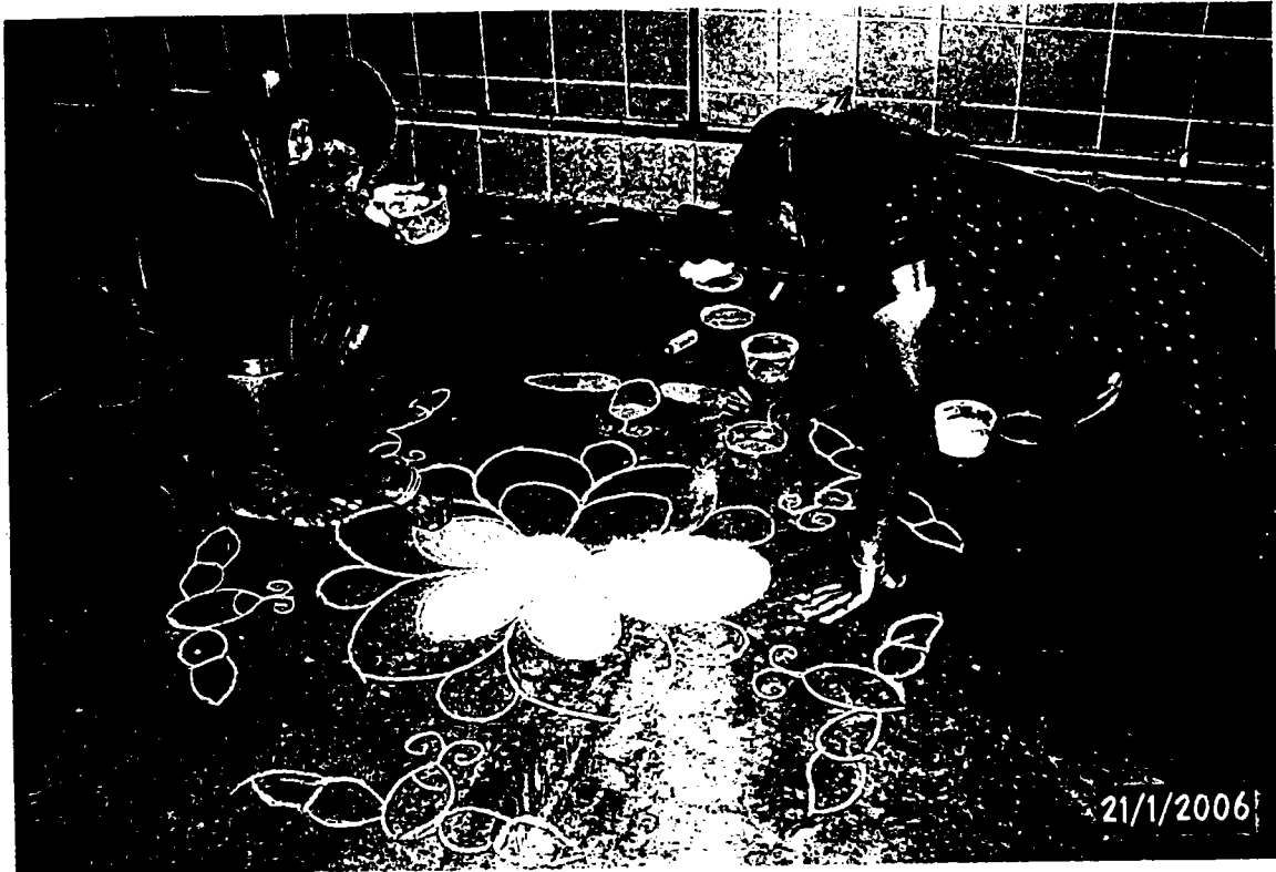
Gambarfoto Pertandingan Melukis Kolam dalam Tamilar Thirunaal Pulau Pinang pada tahun 2006