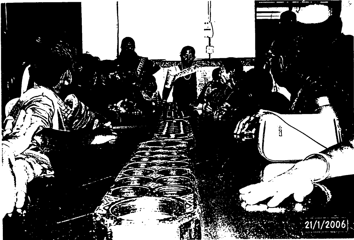
Gambarfoto Pertandingan Memakai Inai dalam Tamilar Thirunaal Pulau Pinang pada tahun 2006