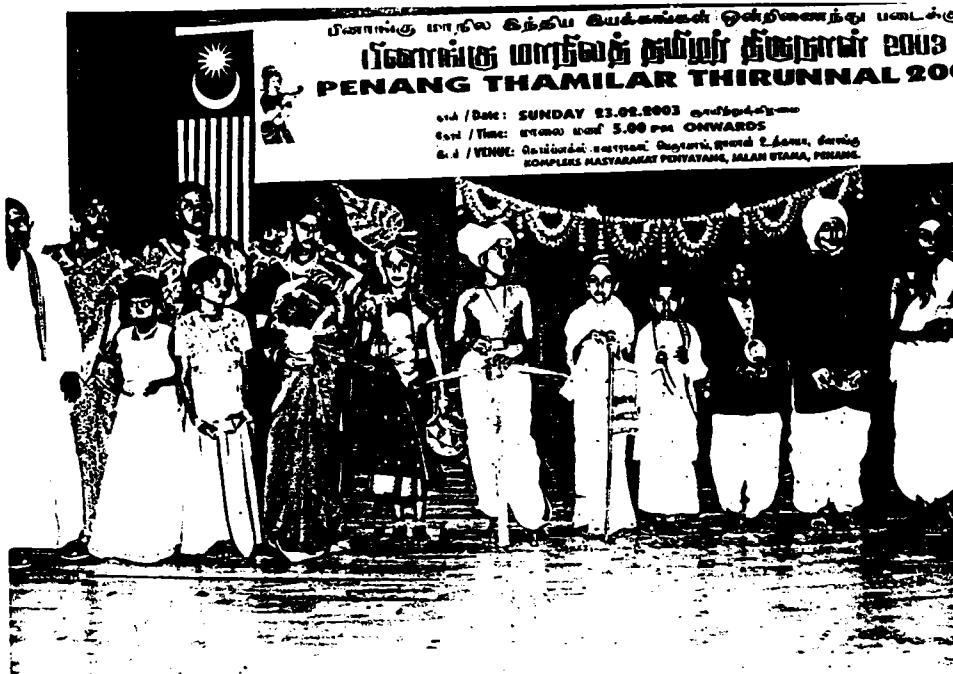
Gambarfoto Peragaan Pakaian Tradisional India oleh Kanak-Kanak Berumur 5 tahun hingga 12 Tahun dalam Tamilar Thirunaal Pulau Pinang pada tahun 2003 dan 2005