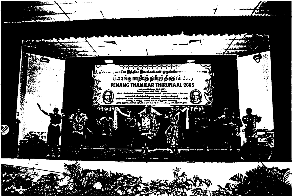
Gambarfoto Persembahan Tarian Klasik dalam perayaan Tamilar Thirunaal Pulau Pinang 2006