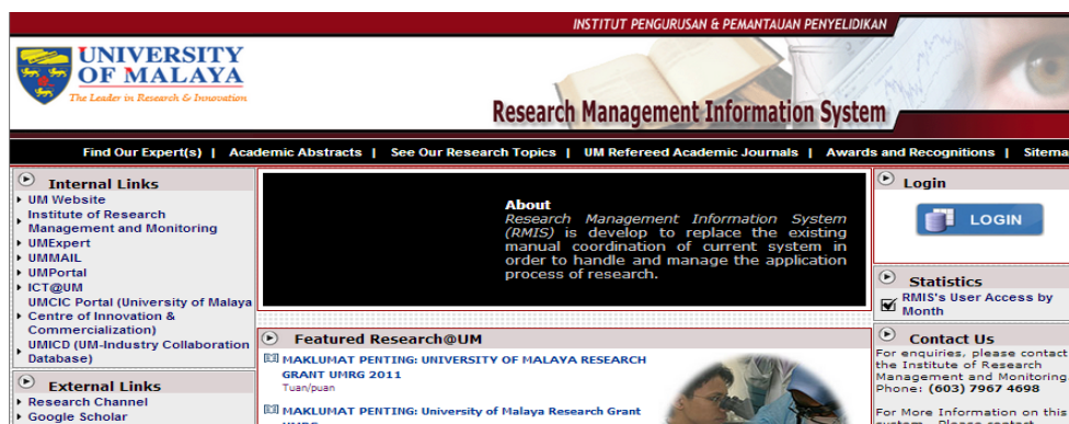
Rajah 3: Research Management Information System (RMIS)

Data penerbitan yang dimuat turun dalam EndNote akan dimuat naik ke Research Management Information System (RMIS) (Rajah 3) yang terkandung dalam UMEExpert untuk diakses oleh semua staf akademik yang mempunyai akaun UMEExpert. Staf akademik dapat mengemaskini CV mereka berkenaan penerbitan dengan merujuk senarai yang dimuatnaik oleh Perpustakaan (Rajah 4) sekiranya penerbitan tersebut sudah diindeks dalam ISI dan Scopus.