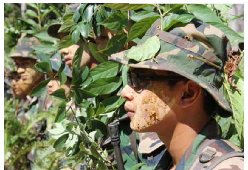
Penyamaran diri adalah sebahagian daripada taktik yang diperlukan dalam latihan menembak di lorong hutan di Kem Hobart yang bertujuan mengelirukan padangan musuh ketika peperangan di kawasan hutan.

Kem Hobart diberi nama bersempena nama Kapten Hobart, seorang pegawai tentera British pada tahun 40an yang membuka kem meninggalkan kisah suka, duka, misteri tersebut di kawasan Hutan Simpan Bukit Perak. Pengalaman berada di kem tersebut adalah satu pengalaman yang paling berharga buat pegawai kadet. Tidak hairanlah jika kem ini sering mendapat liputan akhbar tentang kematian anggota tentera sewaktu latihan. Kesimpulannya, banyak pengalaman yang akan di bawa pulang oleh setiap mereka yang penah hadir di sini. Mungkin pengalaman itu sedikit berbeza kerana mungkin ada juga tidak akan datang untuk kali kedua.