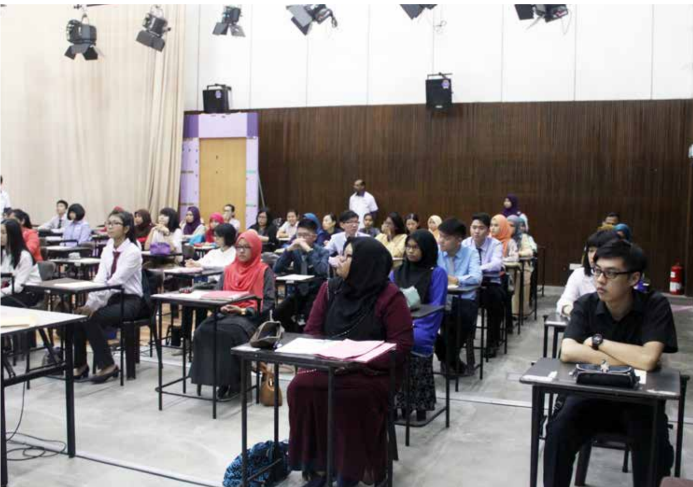
FOKUS... Calon-calon perlu menulis esei dalam bahasa Malaysia dan bahasa Inggeris selama setengah jam sebelum sesi temuduga bagi program Ijazah Sarjana Muda Komunikasi bermula.

Program temuduga kemasukan sidang akademik 2015/2016 untuk program Ijazah Sarjana Muda Ekonomi, program Ijazah Sarjana Muda Komunikasi, program Ijazah Sarjana Muda Sains (PBP), program Ijazah Sarjana Muda Sains dengan Pendidikan dan program Ijazah Sarjana Muda Kerja Sosial telah diadakan di pusat pengajian masing-masing pada 7 dan 8 Mei 2015.