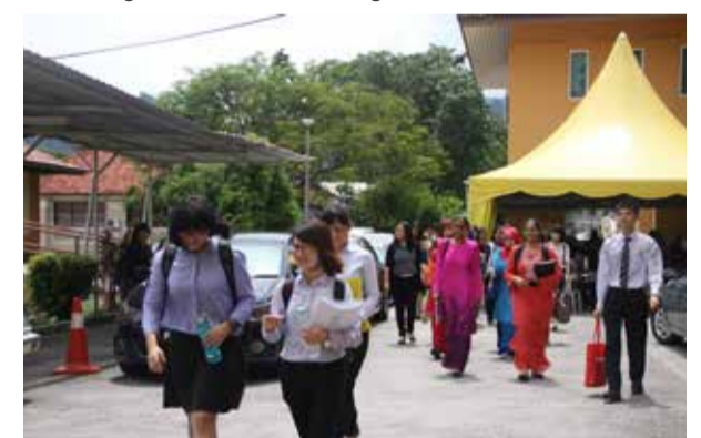
Calon-calon yang Ijazah Sarjana Muda Komunikasi sedang berjalan dengan penuh keyakinan ketika memasuki dewan peperiksaan yang disediakan oleh pusat pengajian Komunikasi.