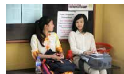
MESRA Calon-calon berkolong berpendapat soalan temuduga yang akan diberikan oleh pensyarah Pusat Pengajian Komunikasi.