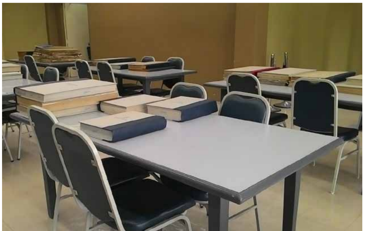
Ruang kawasan membaca Bahagian Arkib Akhbar, Perpustakaan Hamzah Sendut (PHS) 2 membenarkan siswa-siswi meninggalkan akhbar yang ingin digunakan dalam masa tertentu di atas meja untuk keselesaan mereka.

“Siswa-siswi yang menghadapi masalah untuk mencari akhbar boleh dapatkan bantuan staf PHS 2 kerana akhbar tidak mempunyai nombor siri, sebaliknya disusun mengikut tahun”, ujarnya.