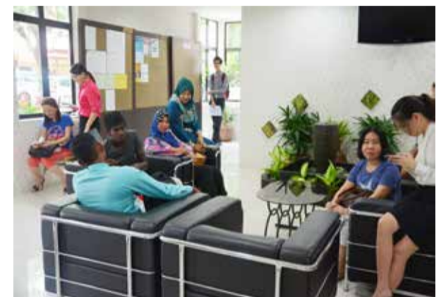
Kesabaran yang diberikan oleh ibu bapa sewaktu menunggu anak-anak yang sedang menghadiri temuduga memberikan semangat dan motivasi kepada calon temuduga.