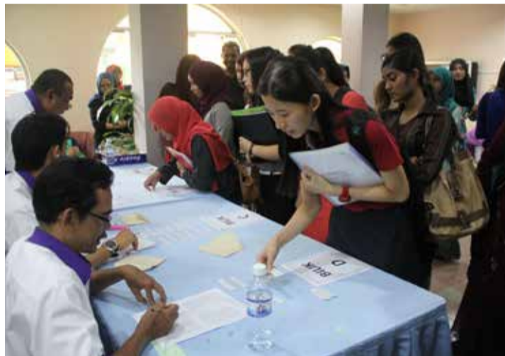
Calon-calon temuduga untuk program Ijazah Sarjana Muda Komunikasi sedang beratur untuk mengambil pelekat nama dan mengenalpasti bilik temuduga yang ditetapkan.