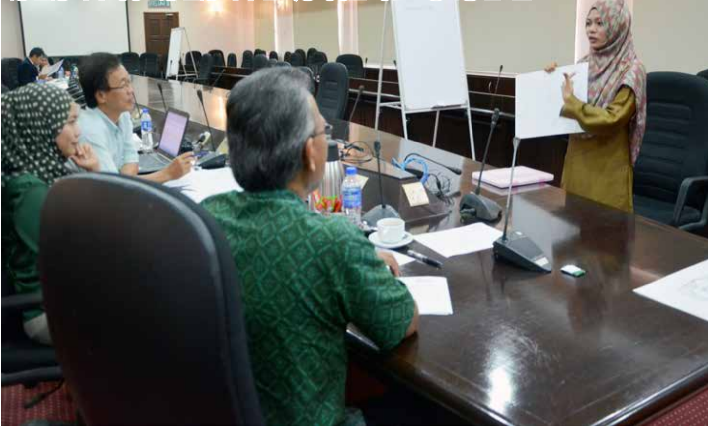
SEMANGAT... Calon temuduga bersemangat mempersembahkan idea dan hasil lukisannya kepada ahli panel di Pusat Pengajian Perumahan, Pembangunan dan Perancangan.