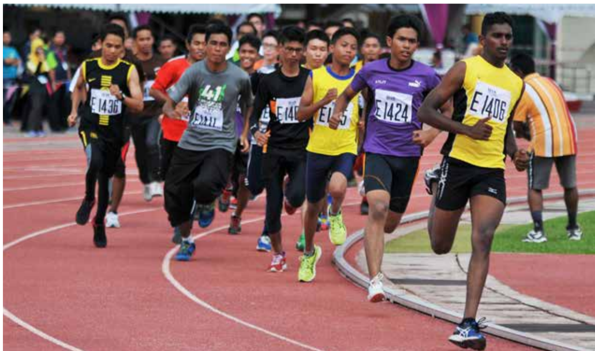
BERSEMANGAT... Peserta lelaki bersemangat dalam acara Larian Sebata Diraja (LSD) yang diadakan di Stadium Olahraga Universiti Sains Malaysia semasa Temasya Olahraga Tahunan ke-41.

Larian Sebata DiRaja (LSD) dan Larian Sebata Tuanku Raja Perempuan (LSTRP) adalah satu tradisi bagi Temasya Olahraga Tahunan (TOT) Universiti Sains Malaysia (USM). LSD telah diperkenalkan pada TOT Ke-15 pada tahun 1989.