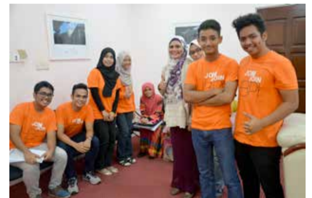
Keceriaan terselah dari siswa-siswi USM yang turut membantu dalam melancarkan pelaksanaan proses temuduga di Pusat Pengajian Perumahan, Pembangunan dan Perancangan.