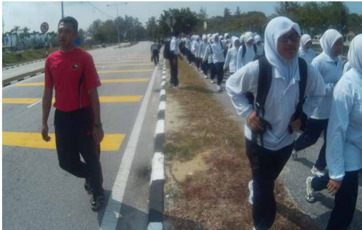
[BAWAH] Menjadi cita-cita beliau untuk menjadi seorang tenaga pengajar apabila diberi kepercayaan untuk menjawat jawatan sebagai Pegawai Jurulatih Peperangan di Kapal Diraja Sultan Idris 1 (KDSI 1) untuk mendidik pegawai-pegawai muda dalam Tentera Laut Diraja Malaysia (TLDM).