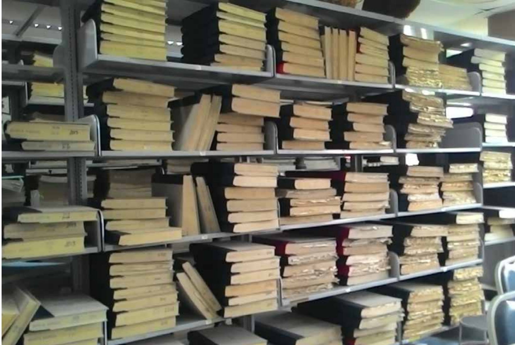
Sebahagian daripada akhbar yang dijilidkan oleh Perpustakaan Hamzah Sendut (PHS) sebelum keputusan menghentikan proses menjilid akhbar dibuat pada Julai 2014. PHS 2 mempunyai arkib akhbar bercetak dari 1950an sehingga Disember 2013.