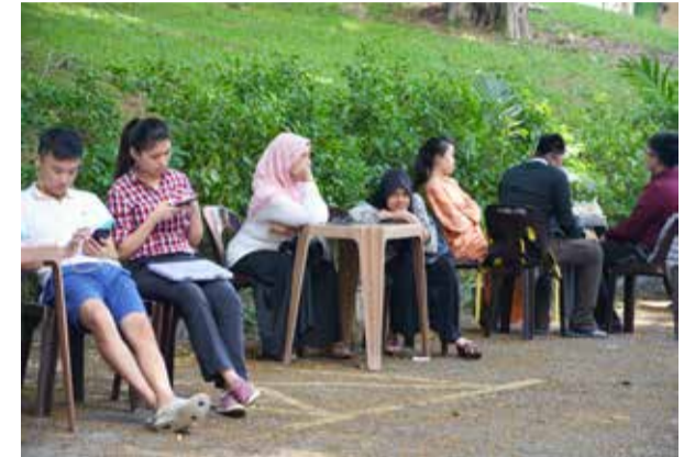
Kepanasan menunggu di luar pusat pengajian tidak menghalang ibu bapa yang hadir untuk terus menunggu anak-anak mereka semasa sesi temuduga dijalankan.

Program temuduga kemasukan sidang akademik 2015/2016 untuk program Ijazah Sarjana Muda Ekonomi, program Ijazah Sarjana Muda Komunikasi, program Ijazah Sarjana Muda Sains (PBP), program Ijazah Sarjana Muda Sains dengan Pendidikan dan program Ijazah Sarjana Muda Kerja Sosial telah diadakan di pusat pengajian masing-masing pada 7 dan 8 Mei 2015.