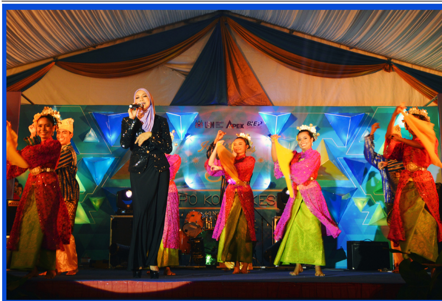
HEBAT Gaya tersendiri penyanyi tempatan, Ziana Zain ketika melakukan persembahan sempena Majlis Penutupan Ekspo Konvokesyen (Convex) 2014 di Tapak Konvo, Universiti Sains Malaysia pada 8 November 2014.

Seramai 25, 258 siswasiswi bergraduasi pada Upacara Konvokesyen Ke-50 USM.