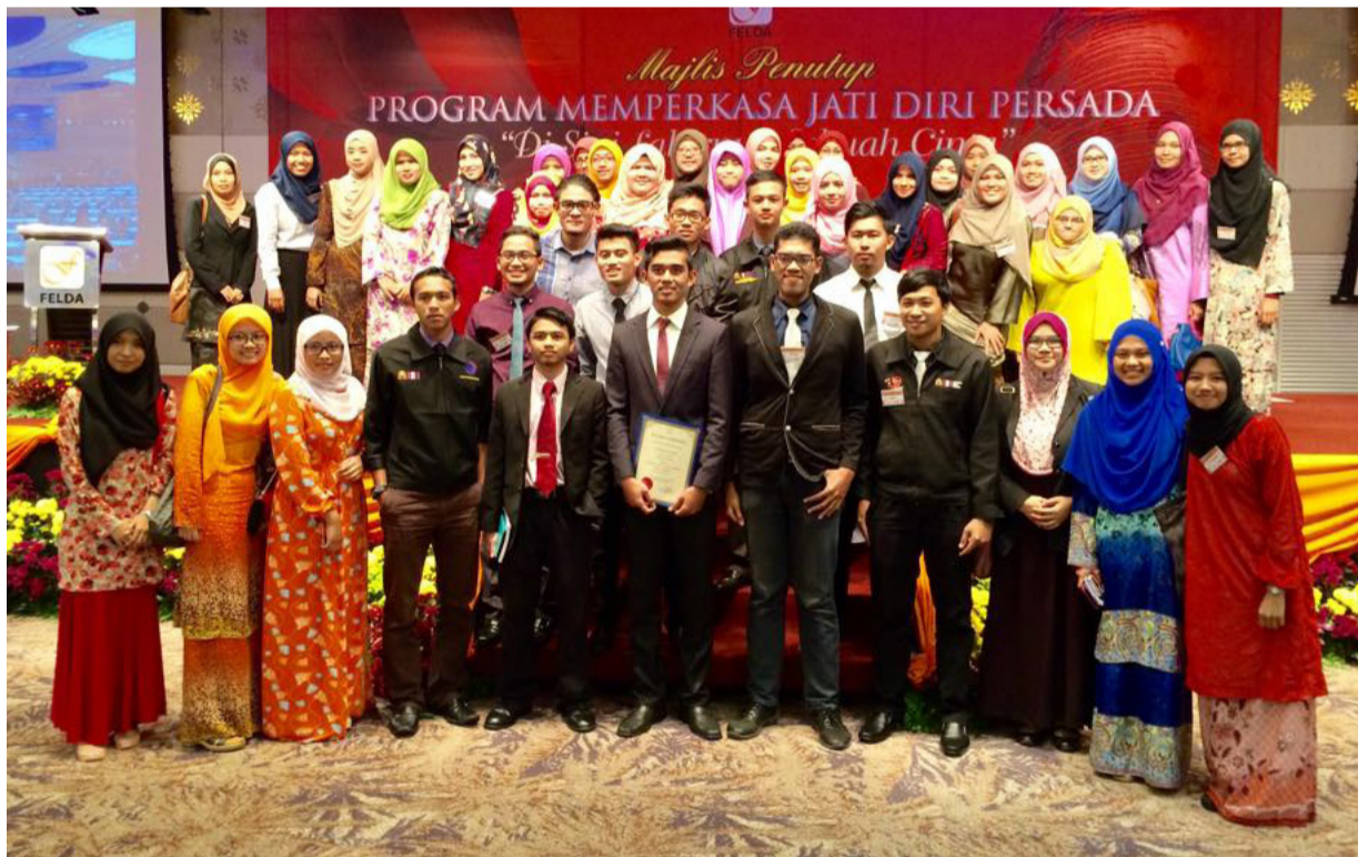
AHLI PERSADA USM....antara persatuan yang aktif melibatkan diri dalam aktiviti-aktiviti anjuran Felda.

Lembaga Kemajuan Tanah Persekutuan (FELDA) telah menganjurkan Program Memperkasa Jati Diri Persada bertempat di Menara Felda, Kuala Lumpur. Program ini berlangsung bermula 8 hingga 9 November 2014.