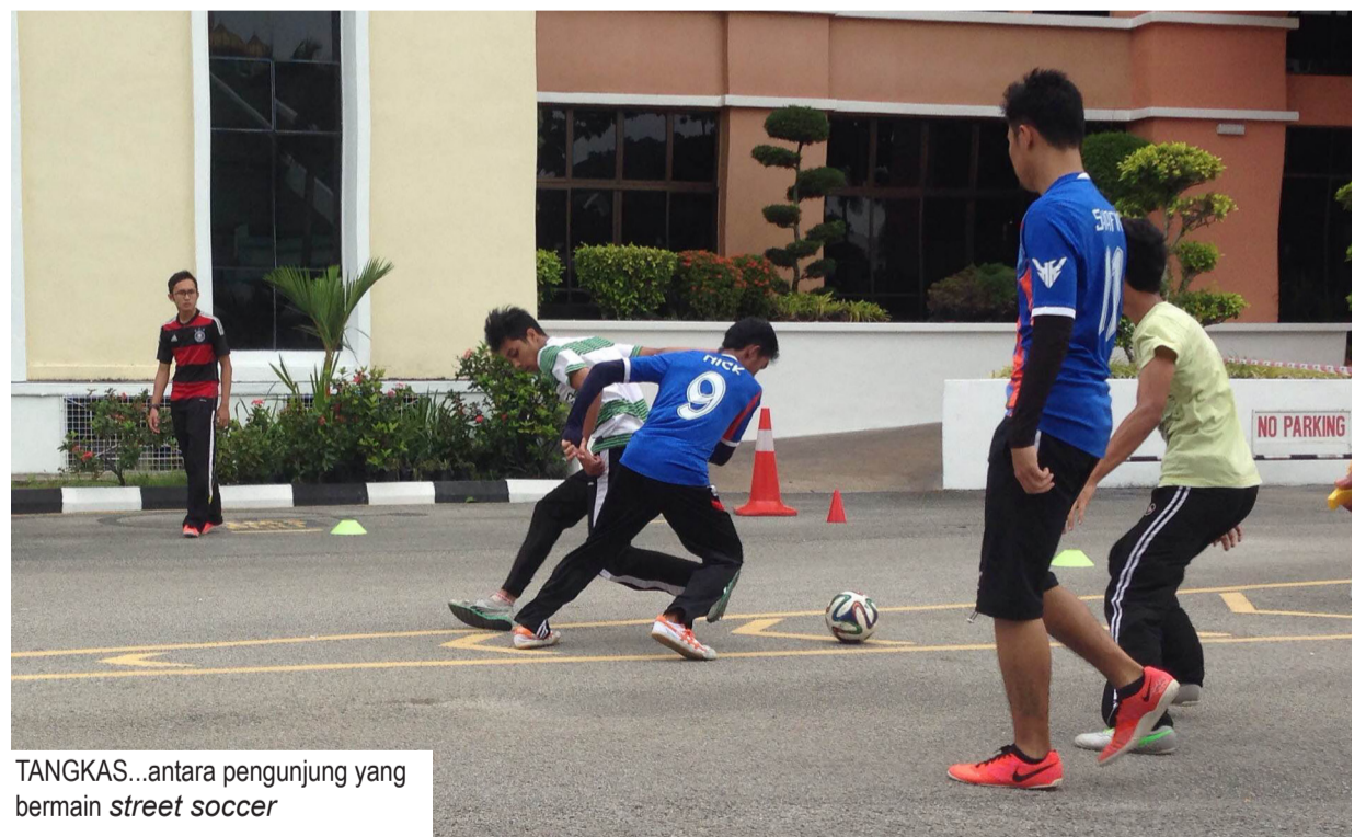
TANGKAS...antara pengunjung yang bermain street soccer

Pada 8 November yang lalu berlangsung program Street Soccer Ekspo Konvokesyen Universiti Sains Malaysia (USM) bertempat di tapak parkir Kompleks Eureka.