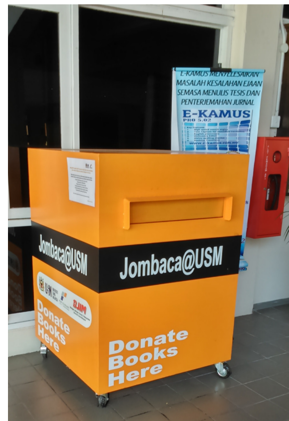
RINGKAS...kotak khas disediakan untuk menderma buku di hadapan Perpustakaan Hamzah Sendut 1

“Kami berhasrat untuk mengadakan kolaborasi dengan pusat pengajian yang ingin mempamerkan hasil kerja siswa-siswi dari semasa ke semasa. Pihak yang berminat boleh menghubungi kami untuk tindakan yang selanjutnya. Peluang ini haruslah digunakan secara optimum kerana ia menjadi satu penghargaan kepada hasil kerja siswa-siswi jika dipamerkan untuk tatapan warga kampus,” tambahnya lagi.