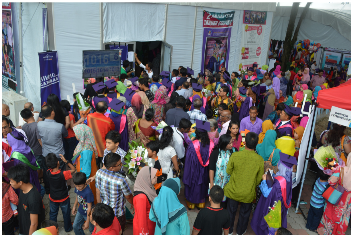
SESAK...keadaan diluar studio penggambaran yang dipenuhi dengan ibu bapa dan graduan yang menunggu giliran.

Perkhidmatan studio penggambaran telah disediakan di Tapak Konvo sempena Upacara Konvokesyen ke-50 di sebelah Dewan Tuanku Syed Putra (DTSP) Universiti Sains Malaysia (USM).