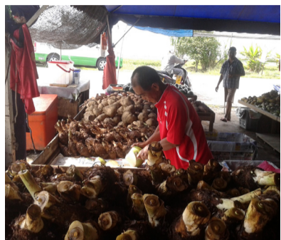
RENCANA Dataran padi memukau pandangan | 12