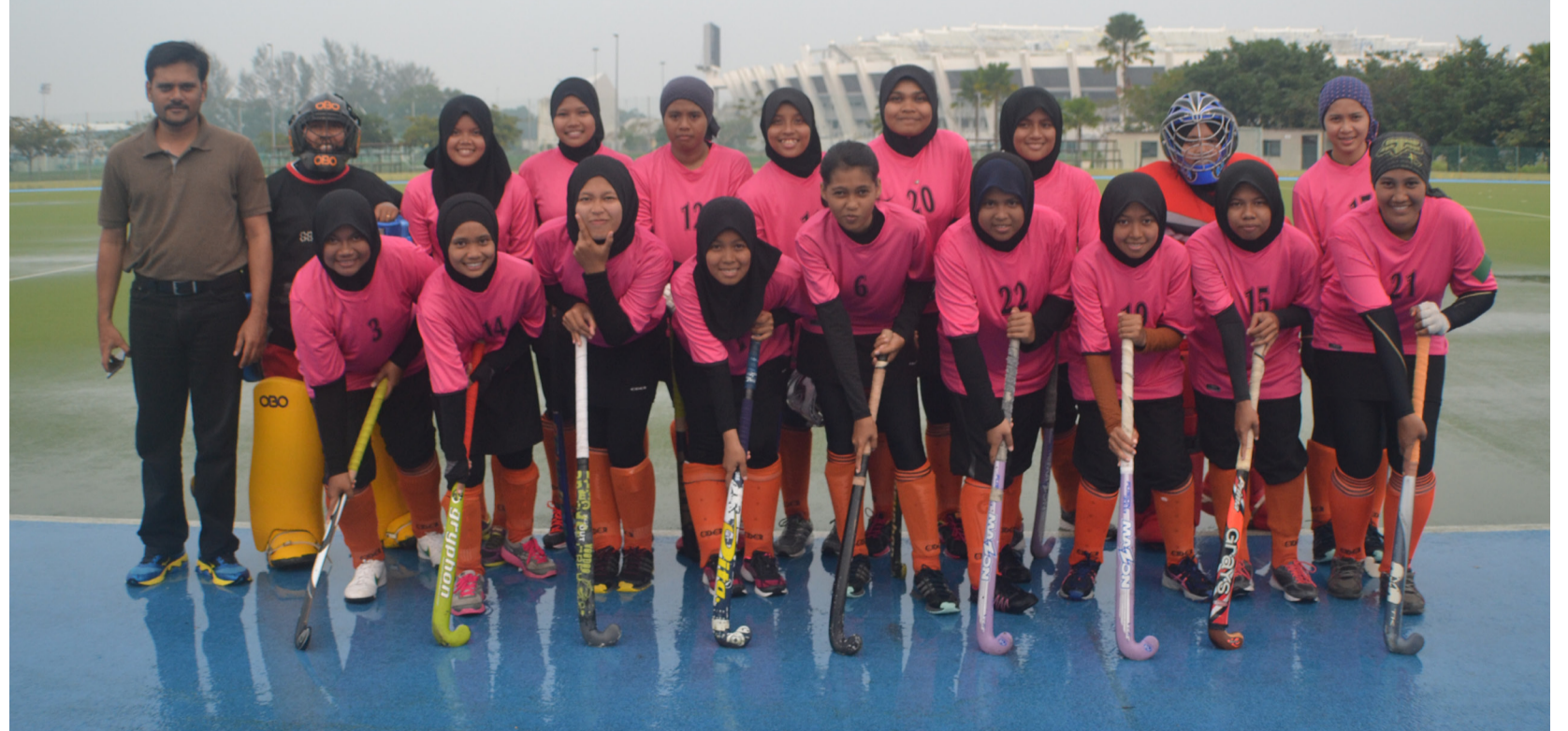
GIGIH... Pasukan Hoki USM, Velfire tidak berputus asa walaupun kalah dalam Karnival MASUM 2014.

Karnival Sukan Majlis Sukan Universiti Malaysia (MASUM) telah berlangsung pada 1 hingga 9 November di Universiti Malaysia Terengganu (UMT). Bertema Bersatu Ke Arah Kegemilangan Sukan Universiti, MASUM telah disertai oleh 20 Institusi Pengajian Tinggi Awam (IPTA).