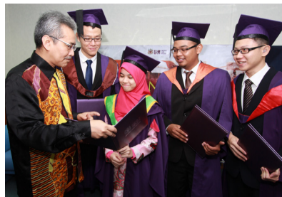
SEKITAR KAMPUS Cemerlang dalam akademik dan kurikulum | 6