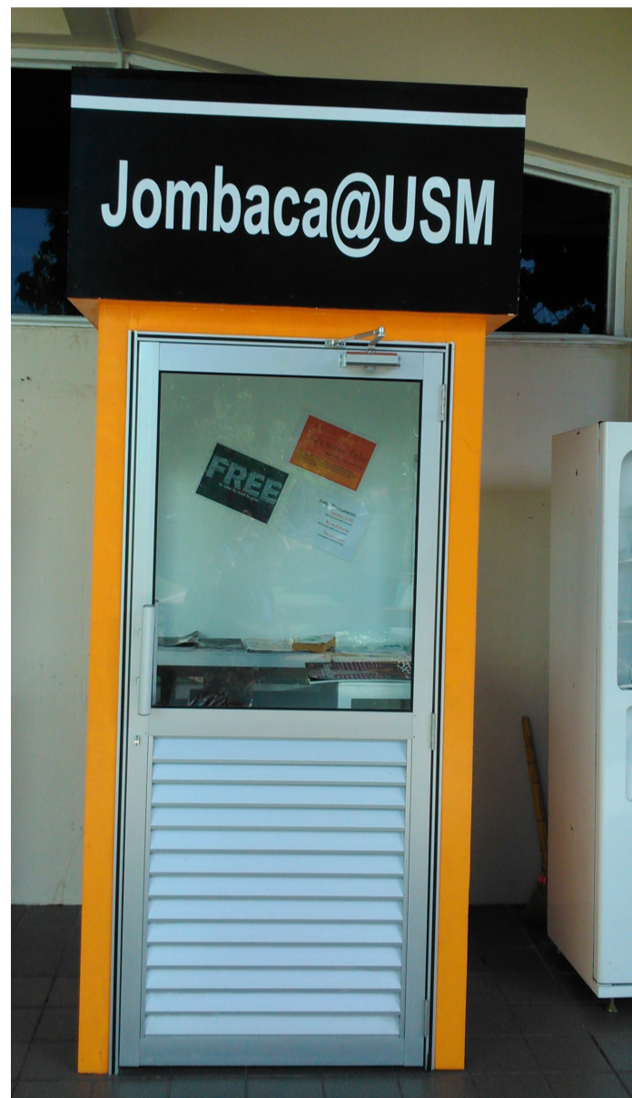
BAHARU...Rak lama untuk ruangan Jombaca@USM digantikan dengan pondok di hadapan Perpustakaan Hamzah Sendut 1, USM

Kamal berharap agar warga kampus akan bekerjasama dan memberikan sokongan dengan mendermakan bahan bacaan dari semasa ke semasa sekaligus menggunakan ruangan Jombaca@USM secara optimum.