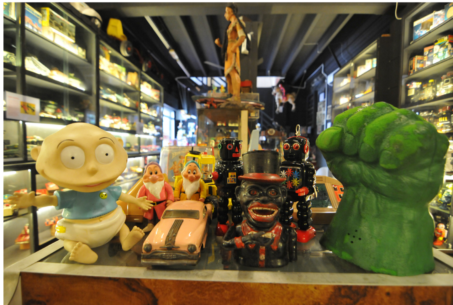
Antara koleksi permainan klasik yang menjadi tumpuan di Ben's Vintage Museum.

Di tengah pelusuk Lebuh Acheh, George Town, terletak sebuah muzium yang mempunyai pameran yang sangat unik, iaitu mainan klasik. Ben's Vintage Toy Museum yang telah dibuka sejak tahun 2009 mempunyai pameran mainan klasik yang terdiri daripada pelbagai jenis – robot, permainan tin, patung lama, permainan konsol, model kereta, dan macam-macam lagi daripada zaman 1930-an sehingga 1990-an.