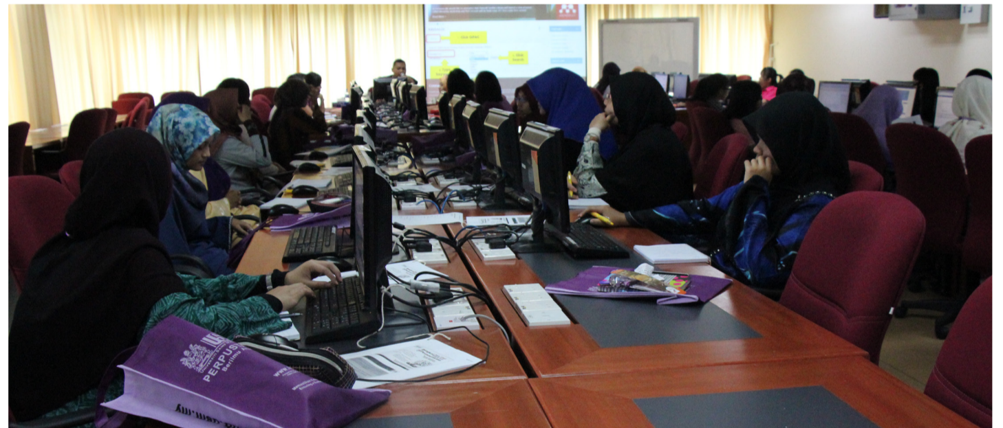
FOKUS antara siswa-siswi yang menghadiri salah satu sesi bengkel selama 1 jam yang berjalan dari pukul 9 pagi hingga 5.30 petang.