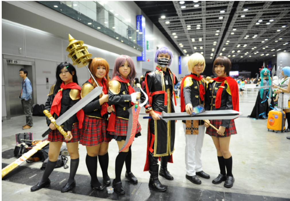
FANS.. of anime gather together during an ACG convention.

The otaku culture is not limited to Japan and it has spread throughout the world. Its existence cannot be ascertained like in Japan with a district dedicated to