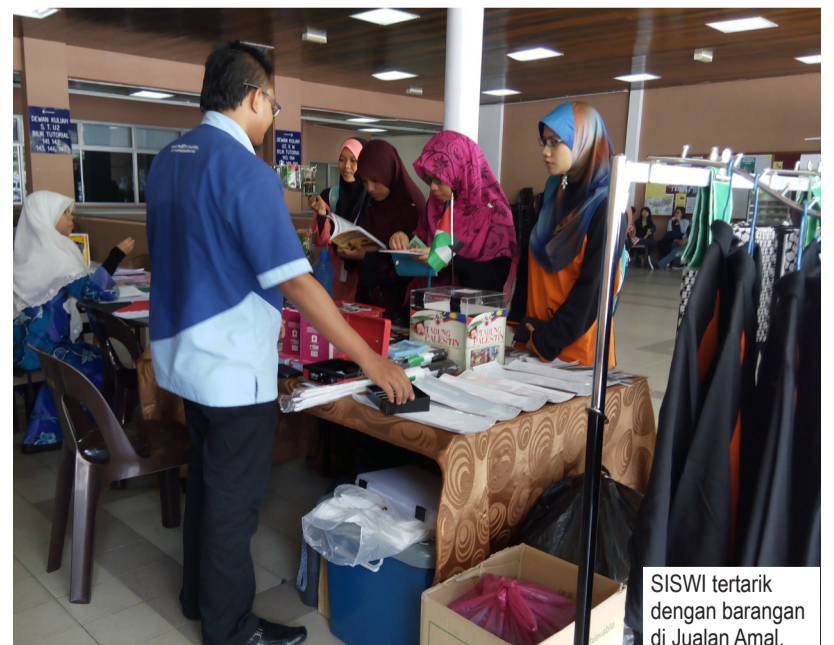
SISWI tertarik dengan barangan di Jualan Amal.

Beliau berkata segala barang keperluan semasa yang diperlukan di sana akan ditentukan oleh kerajaan Gaza dan pihak Aman Palestin akan menyediakan barangan keperluan tersebut dengan menggunakan dana yang telah di kumpul.