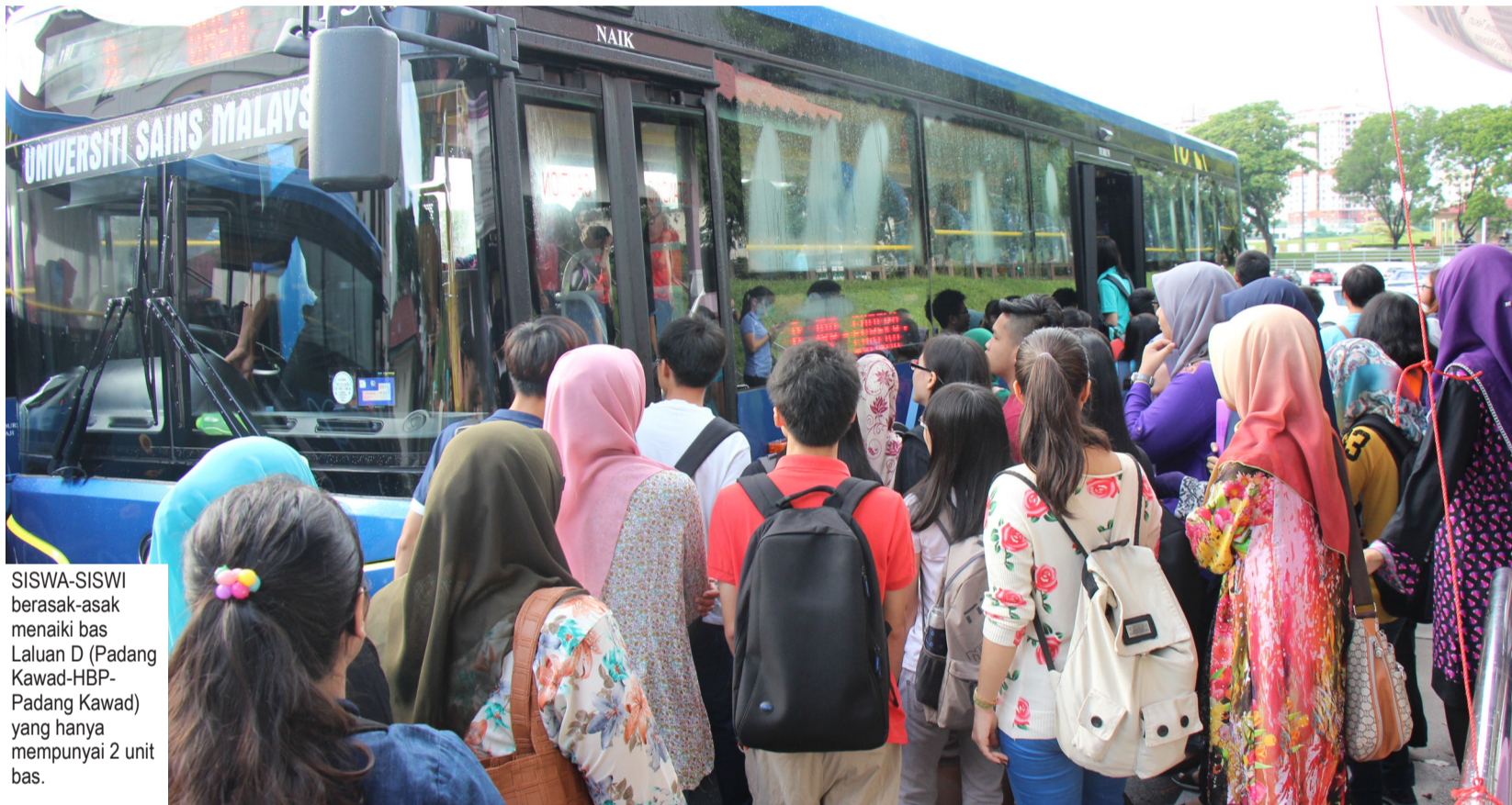
SISWA-SISWI berasak-asak menaiki bas Laluan D (Padang Kawad-HBP-Padang Kawad) yang hanya mempunyai 2 unit bas.

Tambahnya lagi, segala cadangan atau aduan boleh disalurkan kepada Majlis Perwakilan Pelajar (MPP) terlebih dahulu seterusnya perbincangan mengenai tindakan seterusnya boleh dilakukan.