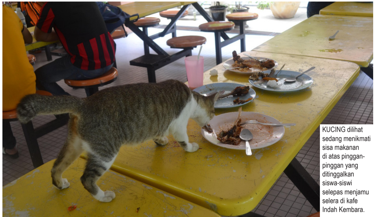
KUCING dilihat sedang menikmati sisa makanan di atas pinggan-pinggan yang ditinggalkan siswa-siswi selepas menjamu selera di kafe Indah Kembara.

Goh Shu Yin, Sains Farmasi 2, memberi cadangan supaya Majlis Penghuni Desasiswa Indah Kembara (MPDIK) dapat menganjurkan program khas kepada penghuni untuk menyuntik kesedaran.