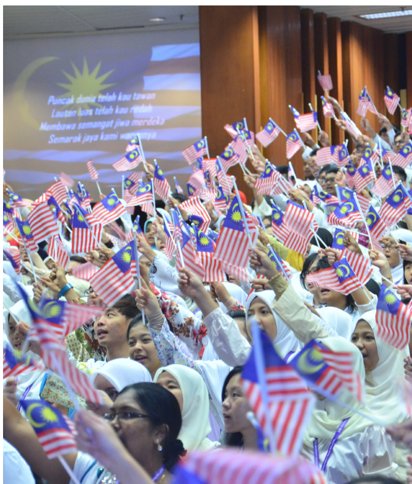
SISWA-SISWI baharu bersemangat menyambut Hari Kemerdekaan.