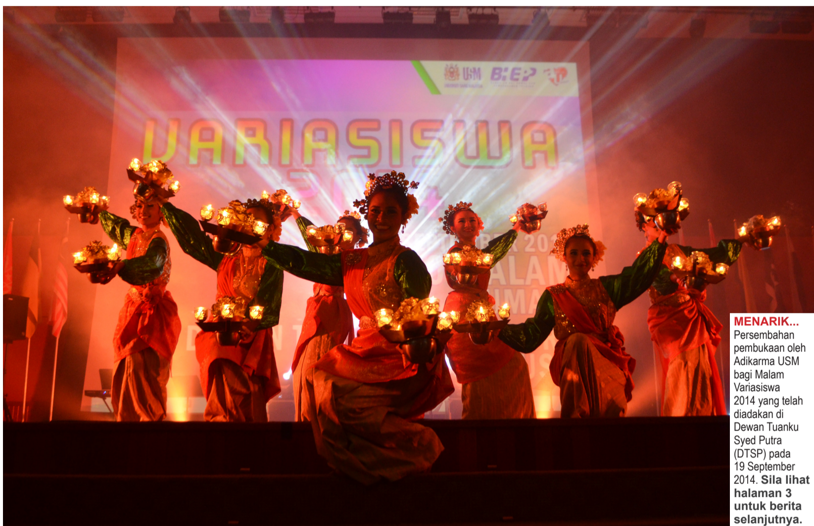
MENARIK... Persembahan pembukaan oleh Adikarma USM bagi Malam Variasiswa 2014 yang telah diadakan di Dewan Tuanku Syed Putra (DTSP) pada 19 September 2014. Sila lihat halaman 3 untuk berita selanjutnya.

“Saya berharap siswa-siswi yang pulang ke desasiswa lewat malam berjalan secara berkumpulan dan berjalan di kawasan yang cerah. Sekiranya perlu bersendirian maklumkan kepada rakan sebilik”, katanya.