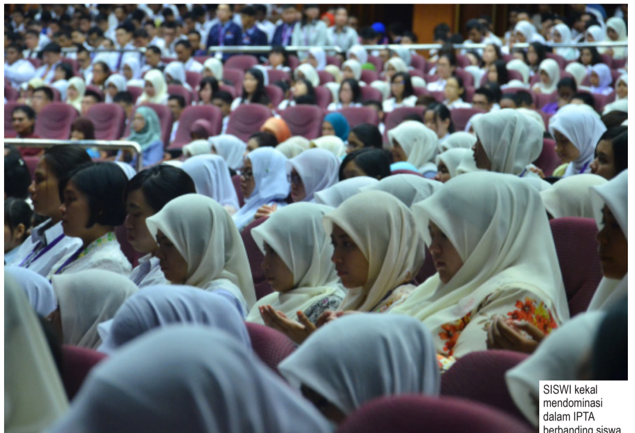
SISWI kekal mendominasi dalam IPTA berbanding siswa.