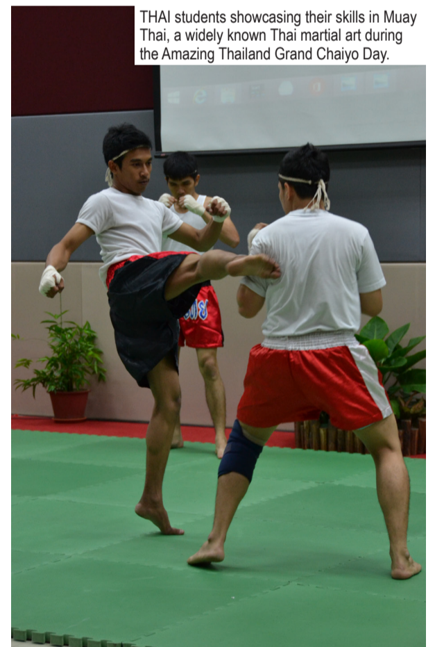
THAI students showcasing their skills in Muay Thai, a widely known Thai martial art during the Amazing Thailand Grand Chaayo Day.

"I was afraid that due to the rain none of you will show up but look at the people here", he said.