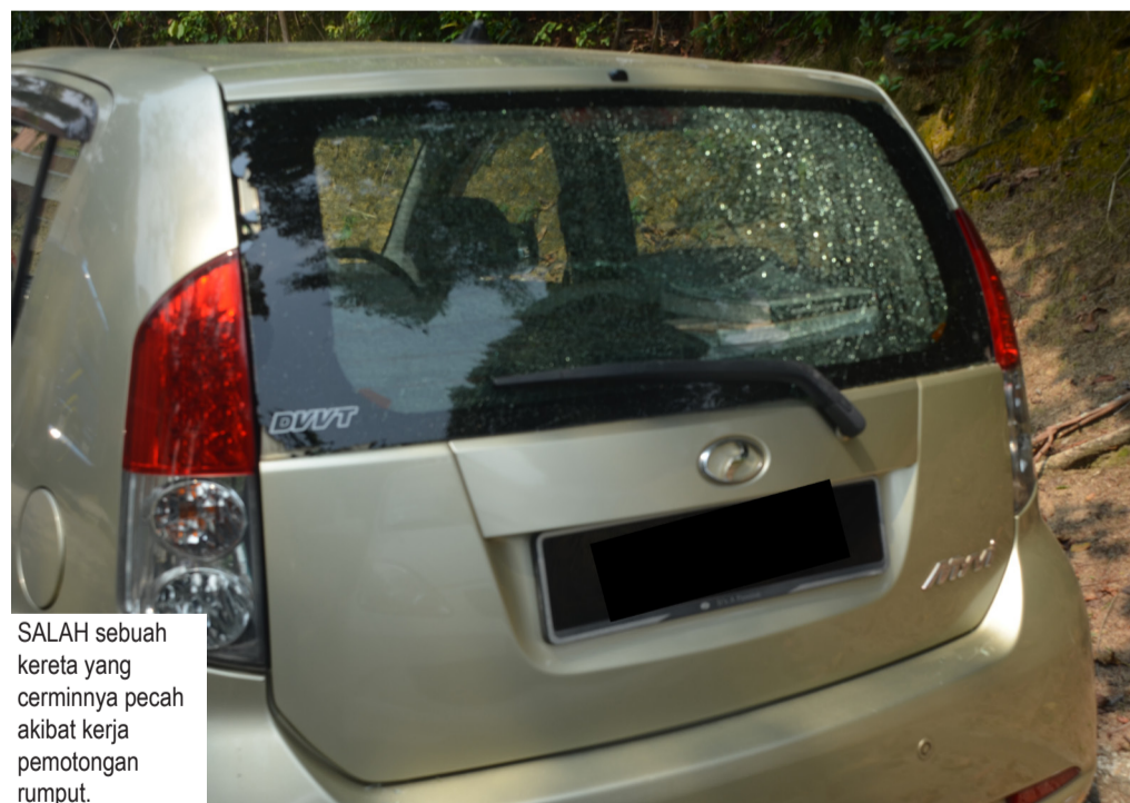
SALAH sebuah kereta yang cerminnya pecah akibat kerja pemotongan rumput.