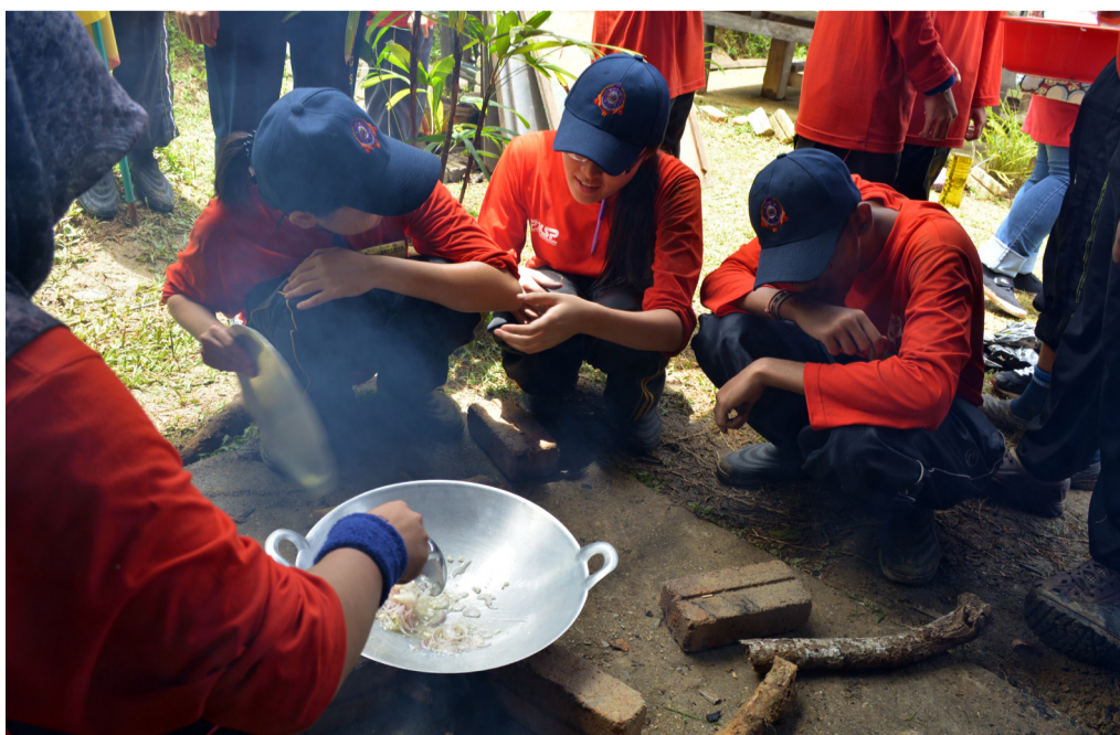
KERJASAMA... Setiap ahli platun bekerjasama dalam melaksanakan kegiatan yang disediakan.

Struktur organisasi Readers ini boleh diperbaiki bagi mencapai objektif penubuhannya. Pemberian mata MYCSD kepada pelajar yang terlibat dalam membantu juga akan disegerakan. Matlamat lain persatuan ini juga adalah supaya siswa-siswi peka dengan kehadiran PKU di dalam kampus, selaras dengan tema utama persatuan ini iaitu Kami cakna, kami prihatin PKU.