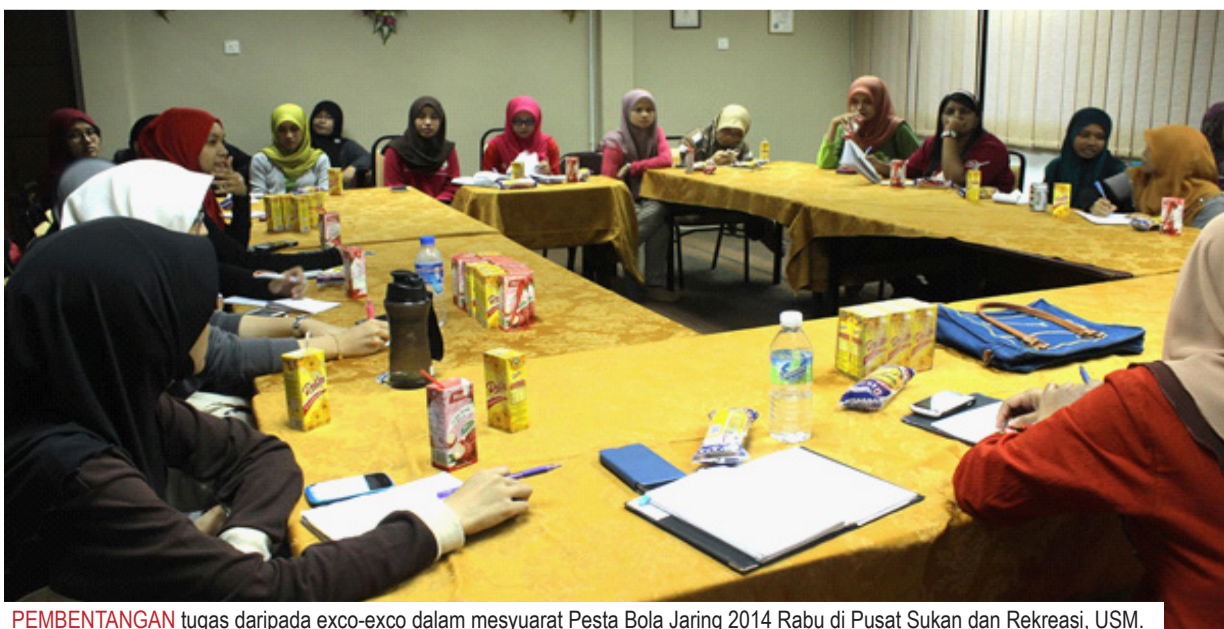
PEMBENTANGAN tugas daripada exco-exco dalam mesyuarat Pesta Bola Jaring 2014 Rabu di Pusat Sukan dan Rekreasi, USM.

Katanya lagi, penyertaan telah dibuka 9 September lalu dan borang penyertaan boleh didapati di laman web rasmi PBJ24. PBJ24 yang akan akan menutup penyertaan pada 2 Oktober ini.