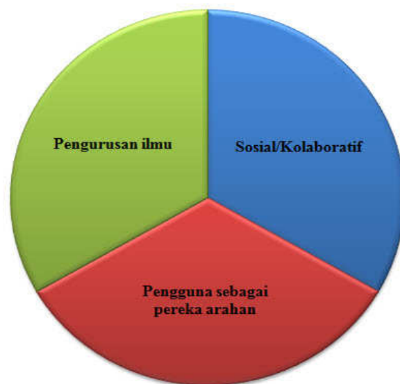
Rajah 1.1: Kerangka kerja Web 2.0 (Tutty & Martin, 2009)

Istilah Web 2.0 mula menjadi popular pada tahun 2003 menerusi O'Reilly Media dan MediaLive yang menganjurkan persidangan Web 2.0 yang pertama. Hasil perbincangan dalam persidangan tersebut, wujud pelaksanaan tiga bahagian Web 2.0 iaitu Rich Internet Application yang berkaitan dengan grafik, Service-Oriented Architecture dan rangkaian sosial yang mendefinisikan bagaimana Web 2.0 mengintegrasikan semua pengguna akhir ( end users ) serta menghasilkan interaksi yang mendalam di kalangan mereka (O'Reilly, 2007). Rajah 1.1 menunjukkan kerangka kerja Web 2.0 yang terdiri daripada tiga bahagian utama iaitu sosial atau kolaboratif ( collaborative/social ), pelajar sebagai pereka ( learner as designer ) dan pengurusan ilmu ( knowledge management ).