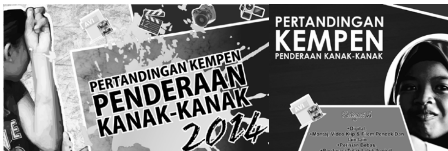
Rajah 11 Poster yang dibangunkan untuk tujuan soal selidik

Melalui temubual dan pemerhatian yang dilakukan di rumah kebajikan masyarakat terhadap kanak-kanak yang didera, pengkaji mendapati kanak-kanak ini dari awal lagi tidak mendapat perhatian yang secukupnya dari keluarga masing-masing. Penceraian ibubapa merupakan faktor yang menyebabkan kanak-kanak ini didera. Ada di antara ibubapa mengamalkan kehidupan yang tidak sihat, menyebabkan persekitaran kanak-kanak ini juga membesar dalam persekitaran yang tidak sihat. Akibat tiada komunikasi dan kurang pengawasan daripada ibu bapa, kanak-kanak ini mencari haluan sendiri atau menjadi mangsa kepada keganasan ibubapa mereka sendiri. Pegawai psikologi di rumah kebajikan ini juga, turut menghuraikan beberapa faktor lain yang menyebabkan kanak-kanak itu menjadi mangsa dera seperti tiada pegangan agama, penceraian, kos sara hidup yang meningkat, ketengangan hidup, tiada komunikasi dan persekitaran tidak sihat untuk kanak-kanak membesar.