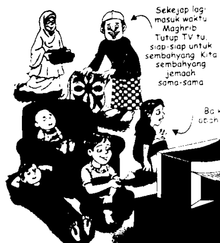
Rajah 3 Menasihati anak-anak melalui kaedah yang sesuai Sumber rujukan: Kaedah Mendidik Isteri dan Anak – Antara Galakan dan Larangan Memukul dalam Islam.

Oleh itu, kajian ini dilakukan untuk mengukur dan mengkaji pemahaman masyarakat khususnya ibu bapa terhadap komunikasi. Komunikasi tidak hanya terbatas melalui pertuturan tetapi ia juga diukur melalui tahap pemahaman masyarakat terutama terhadap kes penderaan kanak-kanak. Pengkajian juga dilakukan berdasarkan beberapa kaedah komunikasi terhadap kes penderaan kanak-kanak yang berlaku di enam buah negeri di Malaysia. Ia adalah sebagai instrument pemujukan dalam mendidik masyarakat.