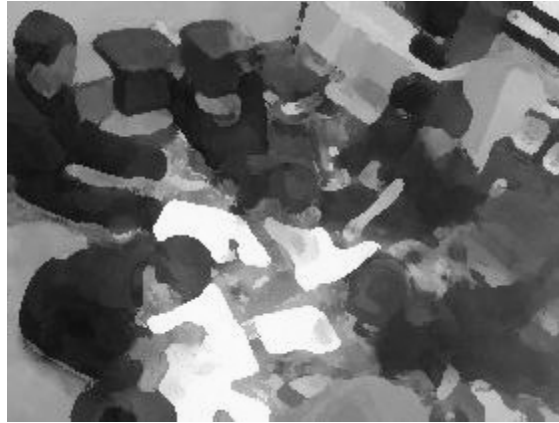
Rajah 5 Kanak-Kanak di Rumah Kebajikan Masyarakat dalam sesi meluahkan pengalaman hidup.

Kaedah Pemerhatian turut serta juga digunakan dalam kajian ini. Semasa sesi temu bual dan pemerhatian terhadap kanak-kanak penderaan ini, sesi meluahkan pengalaman masing-masing telah dilakukan dan pengkaji turut memerhati reaksi mereka melalui kaedah penulisan karangan pendek, 'Kisah Hidup Saya' di rumah kebajikan.