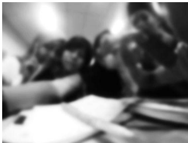
Rajah 6 Sebahagian daripada kanak-kanak bersama dengan penyelidik

Kehidupan mereka di Rumah Kebajikan Masyarakat ini sangat terjaga. Tetapi boleh dikatakan semua kanak-kanak di rumah kebajikan ini, baik lelaki atau perempuan, mereka amat memerlukan kasih sayang dari sebuah keluarga. Setiap kali menerima kunjungan pelawat yang datang melawat mereka, kanak-kanak ini sangat terhibur. Kenyataan ini juga disokong oleh pengetua serta pegawai psikologi Rumah Kebajikan Masyarakat. Selain itu ada di antara mereka juga, mengalami trauma akibat kecederaan yang dialami menyebabkan mereka mengalami kemurungan.