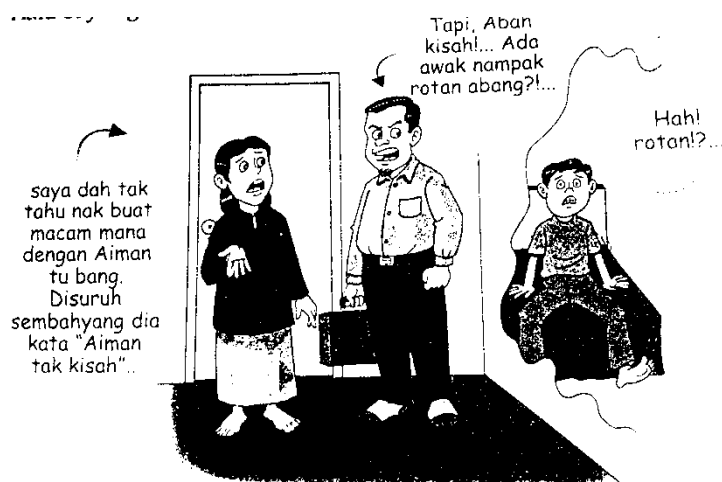
Rajah 1 Kaedah mendisplinkan anak mengikut syarat yang dianjurkan Sumber rujukan: Kaedah Mendidik Isteri dan Anak – Antara Galakan dan Larangan Memukul dalam Islam.

Era kemajuan teknologi tanpa sempadan kini menjadikan dunia semakin kecil. Semuanya mampu disentuh melalui hujung jari. Namun, realitinya menjadikan komunikasi antara ibu bapa dan anak-anak semakin menjarak. Apabila sesuatu hubungan itu mempunyai jurang, berlakulah perselisihan faham, ketegangan hidup dan anak-anak menjadi mangsa ibubapa melepaskan kemarahan.