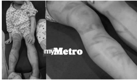
Rajah 9 Mangsa didera pengasuh