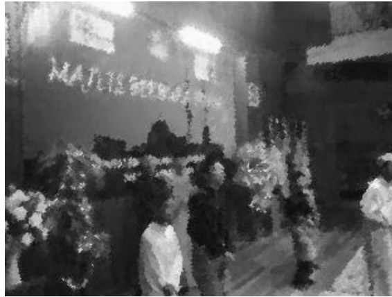
Rajah 7 Persembahan untuk Majlis Berbuka Puasa dari kanak-kanak di Rumah Kebajikan Masyarakat

Rata-rata kanak-kanak di sini apabila ditanya tentang cita-cita mereka, menyatakan mereka ingin menjadi, tentera, polis, askar atau juruterbang. Kanak-kanak ini juga berazam untuk berjaya selepas keluar dari Rumah Kebajikan Masyarakat ini apabila meningkat umur 18 tahun nanti.