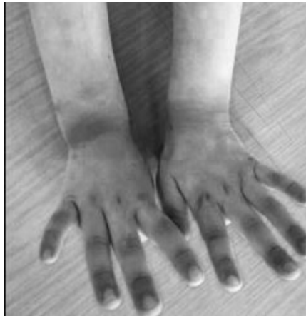
Rajah 10 Mangsa didera di sekolah, diikat tangan hingga meninggalkan kesan