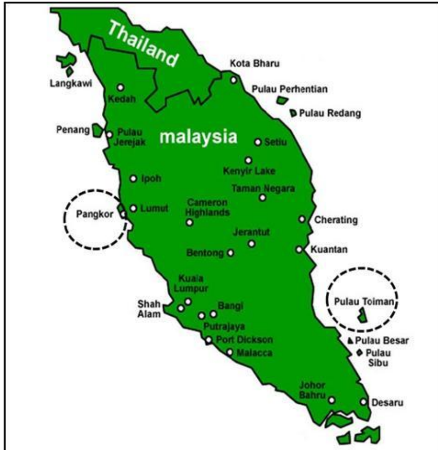
Rajah 1.2: Peta Kawasan Kajian; Pulau Tioman dan Pulau Pangkor

Untuk tujuan penyelidikan ini, dua pulau peranginan dipilih iaitu Pulau Pangkor yang mewakili pulau bahagian Pantai Barat serta Pulau Tioman sebagai mewakili pulau kawasan Pantai Timur Malaysia. Pulau Pangkor ialah pulau penempatan serta pusat peranginan yang terkenal dengan hasil lautnya(Mohamad Fisol, 2012).