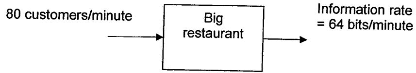
Figure 1: Restaurant information system

Restoran ini menawarkan empat jenis makanan dan kebarangkalian untuk seseorang pelanggan meminta sejenis makanan adalah diberikan seperti dalam jadual di bawah;