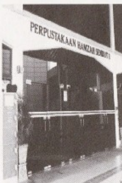
Perpustakaan Hamzah Sendut yang menjadi tumpuan ramai siswa-siswi

Perpustakaan dan siswa-siswa merupakan dua komponen yang mempunyai perkaitan yang erat. Justeru sebagai pengunjung setia