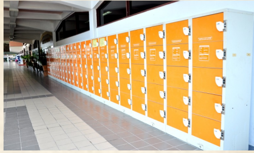
Library Lockers in front of PHS 1