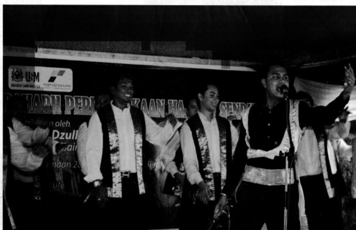
Kumpulan Boria PHS membuat persembahan semasa majlis Perasmian Bangunan baru Perpustakaan Hamzah Sendut

"Kami berlatih selama dua minggu tanpa henti sebelum persembahan bagi