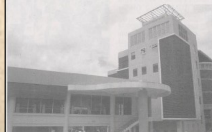
Bilik 24 jam yang baru disediakan di PHS1, USM.

Oleh Zakkiya Wati Ahmad Tarmizi dan Faridah Noor Che Ali