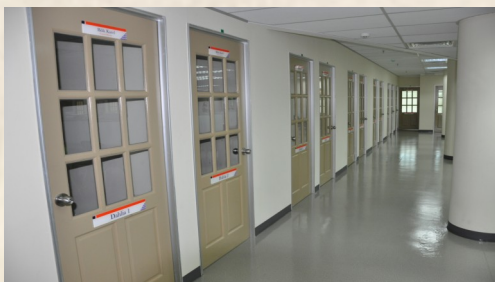
New Carrel Rooms at PHS (New Library Building)