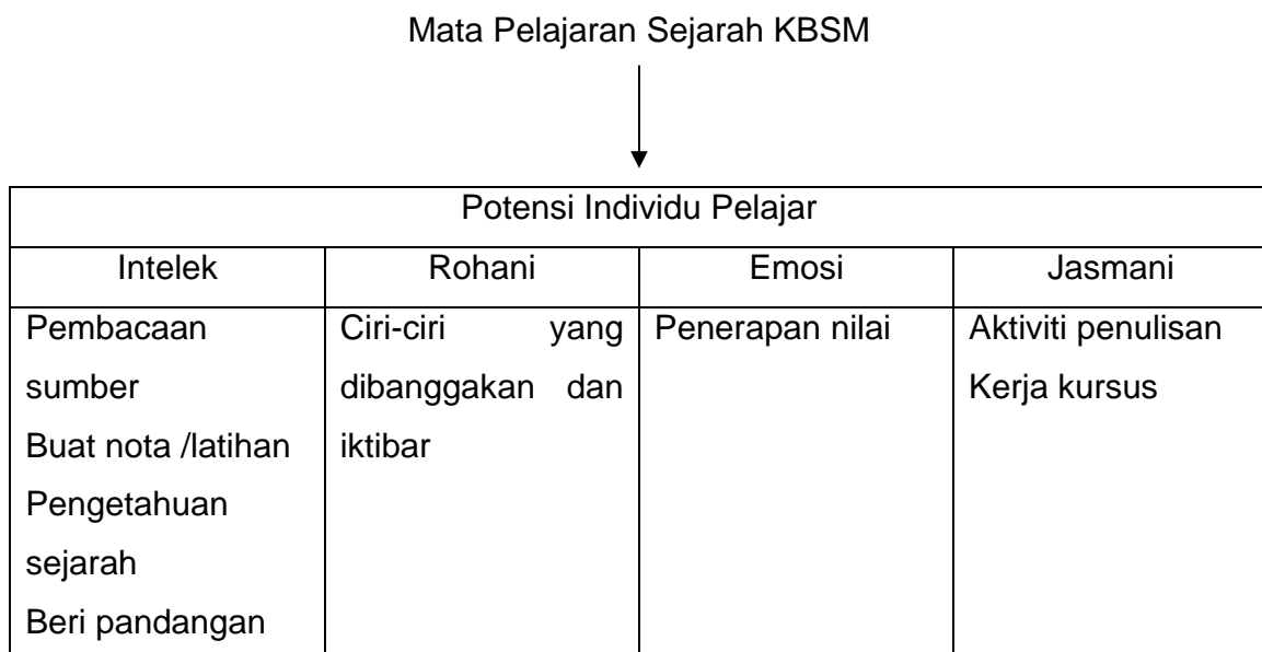
Rajah 2. Perkaitan Mata Pelajaran Sejarah KBSM dengan Potensi Pelajar.

Perkaitan pembelajaran sejarah dengan keempat-empat potensi individu pelajar boleh dijelaskan melalui Rajah 2. Oleh yang demikian, melalui pembelajaran Sejarah KBSM para pelajar bukan hanya disogokkan tentang pengetahuan dalam bentuk fakta-fakta sejarah semata-mata yang memfokus kepada potensi intelek, namun kewujudan fakulti-fakulti lain dalam diri manusia (rohani, emosi dan jasmani) turut diambilkira perkembangannya. Kesemua potensi individu pelajar telah dirancang dan diberi panduan untuk dikembangkan secara seimbang, menyeluruh, bersepadu, dan harmonis dalam proses untuk menyediakan pelajar sebagai warganegara Malaysia yang bertanggungjawab. Cuma persoalan yang timbul ialah, apakah segala perkara ini sememangnya telah diambil perhatian oleh para guru sejarah yang menjadi pengurus dan