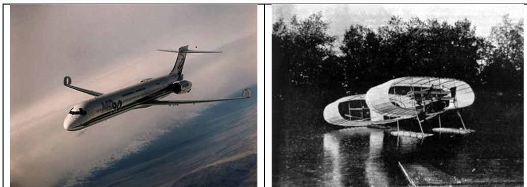
Figure 2: Aircrafts with unconventional wing shape.

Gambarajah 2: Kapal terbang – kapal terbang dengan rekabentuk sayap luarbiasa.