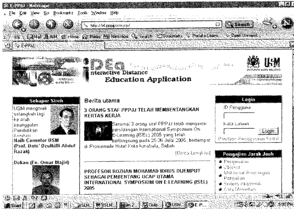
RAJAH 18.1: Muka Hadapan Portal Semasa IDEA