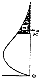
Jadual 5: Titik Peratusan Taburan ki-gandua