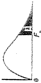
Jadual 3: Nilai Peratusan Taburan F